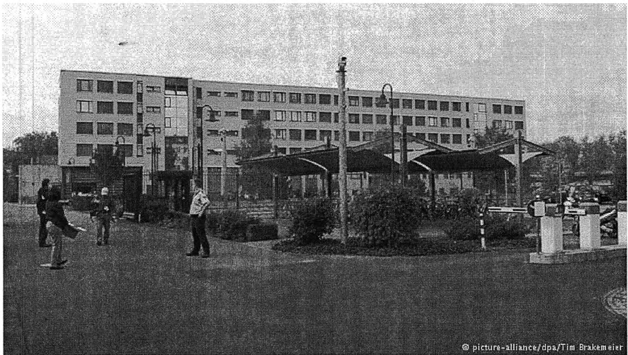
Слика бр.1. Централата на ГТАЦ во Берлин

Апсењето на т.н. „Зауерланд група“, која планирала серија бомбашки напади во Германија, е еден од најдобрите примери за превенција на терористички напади. Информацијата дојде од американските разузнавачи, но германските безбедносни служби добро ја изведоа акцијата, вели Топхофен.