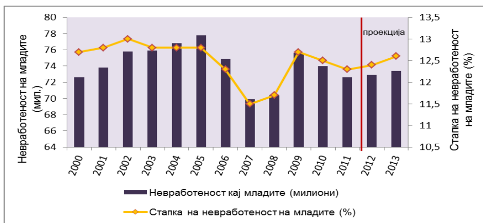
Слика 1 Невработеноста на младите во апсолутни бројки и стапки на невработеност на младите во светот (2000 - 2011) [3 р8]

Европската должничка криза и кризата на еврото посебно ги погоди земјите членки на ЕУ, при што, негативниот импакт на пазарот на труд најмногу го почувствуваа младите лица - фактички многу повеќе од другите возрасни групи. Имено, на крајот на 2012 година, стапката на невработеност на младите во ЕУ-27 беше 2,6 пати повисока од општата стапка на невработеност. Состојбата со невработеност на младите е најтешка во земјите на ЕУ кои најсилно беа погодени од кризата - Грција, Шпанија, Португалија и Ирска. Но, поради кризата на еврото, јазот помеѓу невработеноста на младите и на останатите возрасни групи во земјите членки на ЕМУ, исто така силно порасна, а на крајот на 2012 година дури беше повисок од просекот на ЕУ-27.