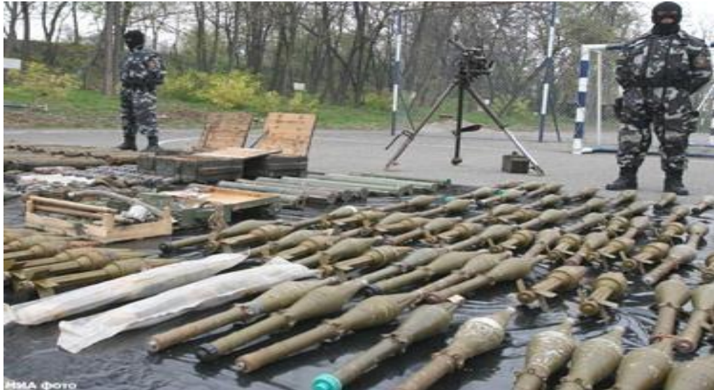
Слика 4: Припадници на безбедносните сили со дел од заплнетото оружје од акцијата „Планинска бура“

борци. Во текот на овие три акции е утврдено дека најчесто за средби се користат цамии, разговори и организирање со членовите на групите. Од прилика во истиот временски период, тогашниот претседател на Македонија Ѓорге Иванов, изјавува дека безбедносните служби во Македонија имаат информации за 84 лица вратени од боиштата на Блискиот Исток и дека истите претставуваат опасност кон безбедноста на државата и граѓаните.