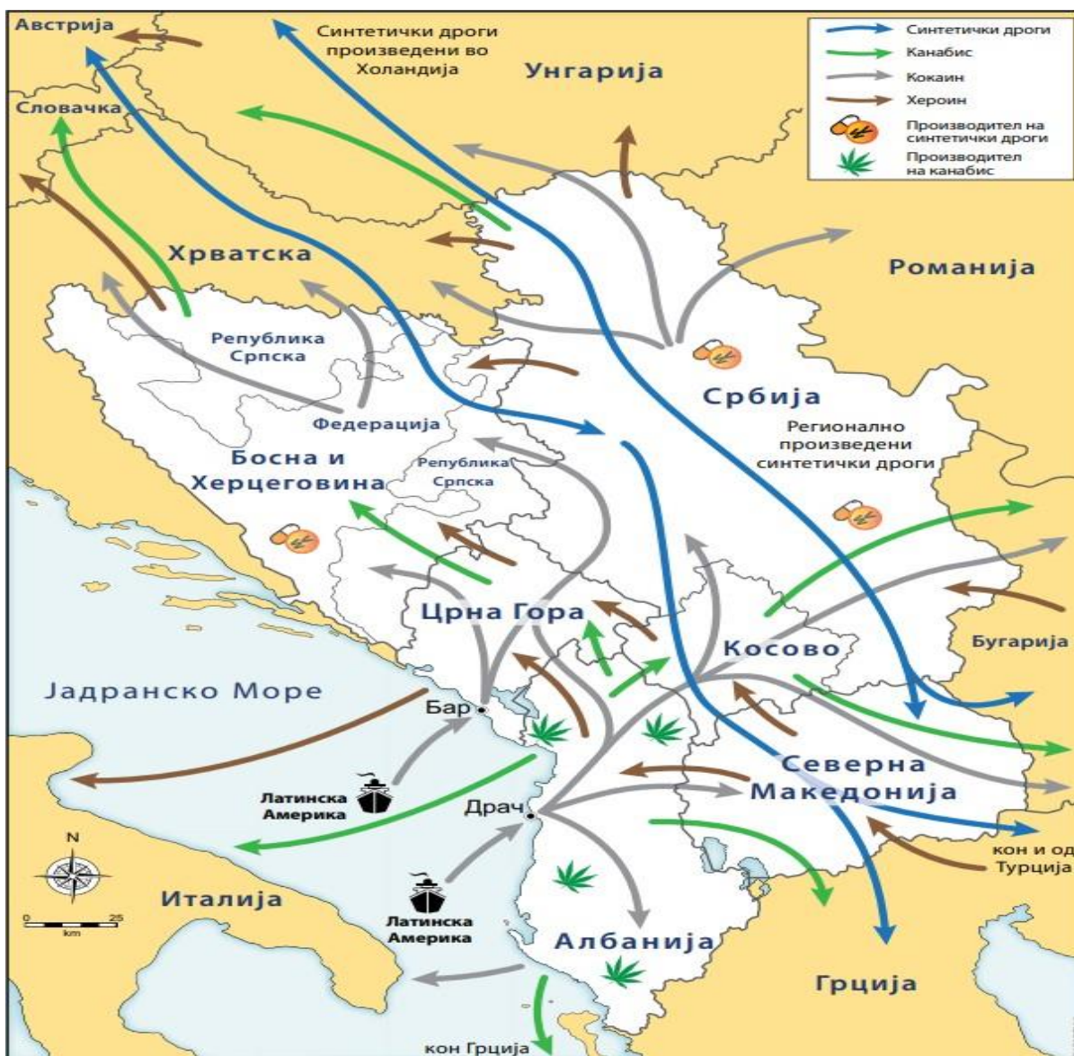
Слика 3: Балканските рути на криминлното подземје

Впрочем, секој нелегален производ кој доаѓа од Африка или Блискиот Исток, а е наменет за државите од Европската Унија, мора да помине низ оваа територија. Исто така, пристаништата во Албанија и Црна Гора играат главна улога при „увозот“ на кокаинот од кој доаѓа од Латинска Америка, а понатаму се дистрибуира во внатрешноста на Европа. Од овие пристаништа се транспортира и канабисот кој во најголем дел се произведува во Албанија, а е наменет за пазарот во Северна или Јужна Америка, Азија или Блискиот Исток.