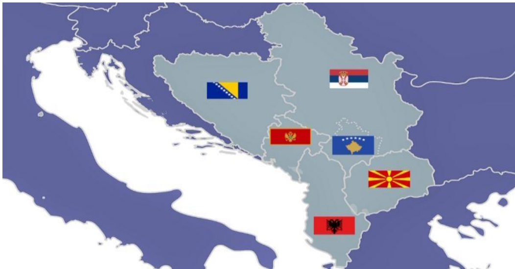
Слика 1: Земјите од Западен Балкан претставени на мапа

Западен Балкан е регион на Балканскиот Полуостров кој го сочинуваат државите Македонија, Албанија, Србија, Косово, Босна и Херцеговина и Црна Гора. Тие се држави со испреплетено минато, држави кои споделуваат многу заедничка историја, војувале помеѓу себе, но и соработувале и се развивале. По завршувањето на трите војни по распадот на Југославија во овој дел од Европа, државите почнуваат заеднички да се развиваат, напредуваат, но и да соработуваат на полето на безбедноста со цел да си ги заштитат своите територии и граѓани од внатрешни и надворешни непријатели. Имајќи предвид дека Балканот е „буре барут“, оваа тема е навистина чувствителна и мора да се обработува со посебно внимание.