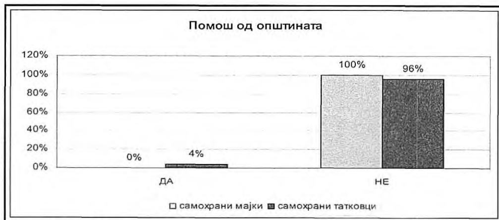
Графикон 5. Помош од општината

Графикон 5 ги покажува одговори на испитаниците во однос на прашањето за користење помош од општината во која живеат. Иако согласно Законот за социјална заштита, општината, Градот Скопје и општините во градот Скопје обезбедуваат остварување на социјалната заштита на бројни категории на лица меѓу кои и децата од еднородителски семејства, како и подигнување на свеста на населението за потребите од обезбедување на социјалната заштита, одговорите на ова прашање се загрижувачки. Сите женски испитаници (100%) и високи 96% од машките испитаници, одговорија дека не добиваат никаква помош од општината во која живеат. Само еден самохран татко одговори дека добива помош од општината во која живее, без конкретно да наведе за каков вид на помош станува збор.