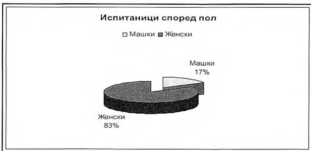
Графикон 1. Испитаници според пол (ЦСР – одделенија за брак и семејство)

Во табела 7 е даден преглед на најчестите проблеми кои стручните работници ги воочуваат кога работат со партнери во постапката за доверување на деца при развод на брак. Најголем дел од испитаниците ја истакнуваат неподготвеност на мајката и на таткото да го прифатат фактот дека родителското право подеднакво им припаѓа на двата родители, како и неподготвеност на партнерите да ги прифатат нормите за работа на стручните лица. Потоа, како проблем се издвојува и насилно однесување на мажот кон жената. Останатите проблеми се поретко воочени.