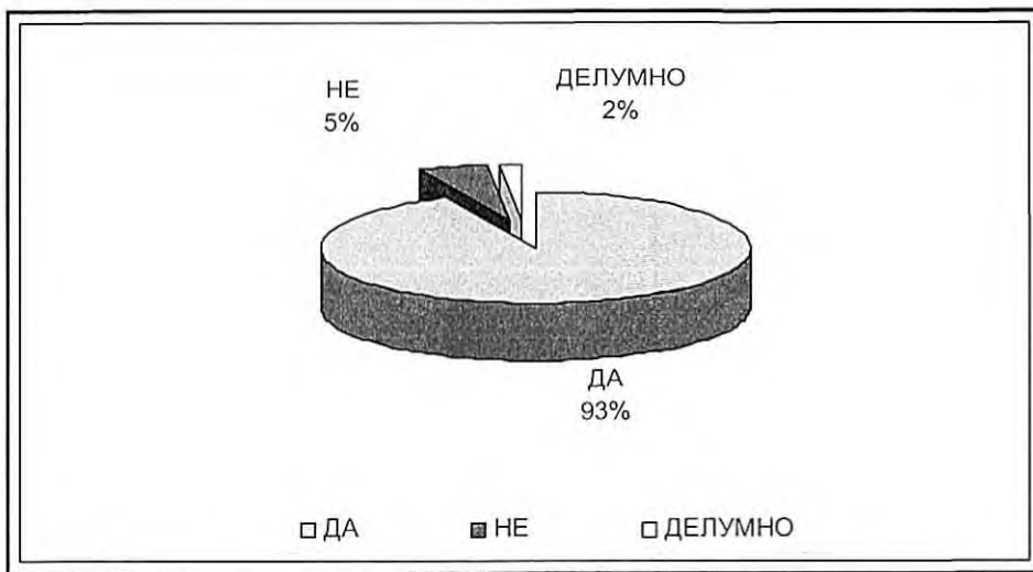
Графикон 2. Прифатени предлози на ЦСР од страна на судот за доверување на дете кај еден од родителите

Графикон 2 го претставува процентот на прифатени предлози од ЦСР за доверување на детето/децата кај еден од родителите, од страна на судот.