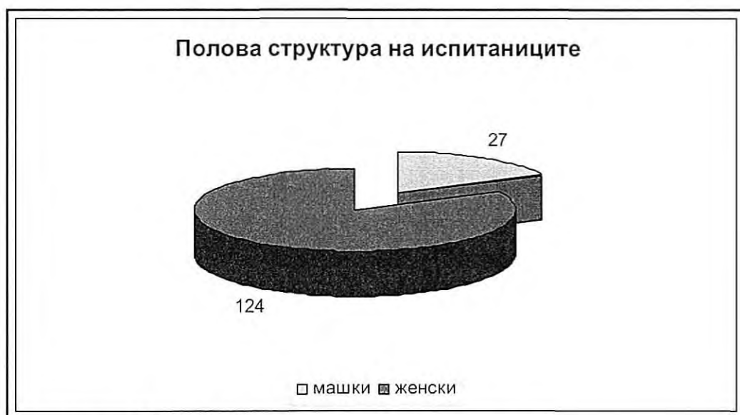
Графикон 3. Полова структура на испитаниците

Согласно половата структура на испитаниците, во истражувањето учествуваа 124 (82,12%) самохрани мајки и 27 (17,88%) самохрани татковци.