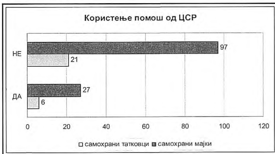
Графикон 3. Користење помош од ЦСР

Графикон 3 го покажува бројот на машки и женски испитаници кои користат или не користат некаква помош од ЦСР. Видливо е дека 97 (78,23%) самохрани мајки и 21 (77,78%) самохрани татковци не користат никаква помош од ЦСР.