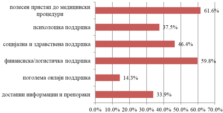
Слика 3. Препорака за пандемија