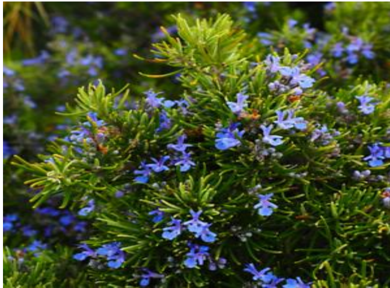
Слика 1. Изглед на растението рузмарин.

Рузмаринот претставува исправена грмушка која може да достигне и 2 м во висина. Неговите зимзелени листови по боја се темно зелени озгора, а бели и влакнести оздола. Листовите се 2 до 3,5 cm долги, свиткани навнатре долж рабовите. Виолетово-белите или белузлави цветови се раѓаат во мали пазувни гроздови (изникнуваат во аголот помеѓу листот и стеблото). Цветната чашка (збирен поим за сите зелени листенца од цветот, sepalum ) и цветното венче (збирен поим за сите обоени листенца од цветот, petalum ) се двоусни, при што горната усна достигнува должина од околу 1,25 cm и ги опфаќа двата прашника, машките полови органи на цветот. Растението рузмарин е самодоволно (т.е. може да се оплоди себеси), но, како што обично бива во целото семејство, прашниковите кеси (машки структури во цветот каде што се создава поленот) запираат со производство на полен пред жигот на толчникот (женскиот дел) да созрее во истиот цвет. Па затоа, растението се потпира на опрашувачите да го пренесат поленот од еден цвет на друг. Често пати, поленот од еден цвет се пренесува на созреан жиг во друг цвет од истото растение, со што доаѓа до самооплодување. Самооплодувањето на растението рузмарин обично дава помалобројно и полесно семе одошто при вкрстено оплодување (т.е. кога