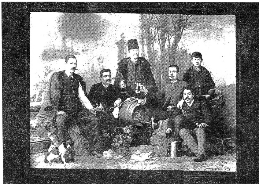
Сл. 2. Гоце Делчев на митровденска кукна слава кај Бабовци (Прилеп, 8 ноември 1901 г.)

Оригиналната слика (сл. 2, Гоце Делчев на митровденска слава кај Бабовци во Прилеп, 1901 година) е во размер 18,5/ 24 см. 13 Снимена е во кафеникава, платинаста нијанса, а урамена во темнозелена рамка. Во долниот дел на рамката е втиснат амблемот на фото - фирмата на Д. А. Карастојанов со златести кирилични и латинични букви. Нејзиното седиште било лоцирано во центарот на Софија спроти Соборниот храм. 14