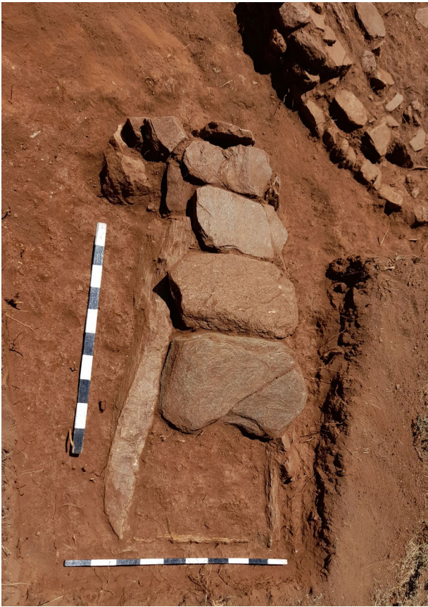
Ил. 5 - Гроб 15 - нео̀творен (по̀зглед од за̀пад)