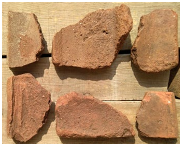
Ил. 9 - Покривна керамика евидентирана во Конструкцијата Fig. 9 - Roof ceramics registered in the Structure

и железното сечиво од нож, наведуваат на првична хронолошка детерминација на конструкцијата во подоцнежниот римски период (табла III, 1, 2). Нови наоди со ископувања во длабочина во идна истражувачка кампања би ја потврдиле или отфрлиле оваа претпоставка, а би помогнале и во определувањето на нејзината намена.