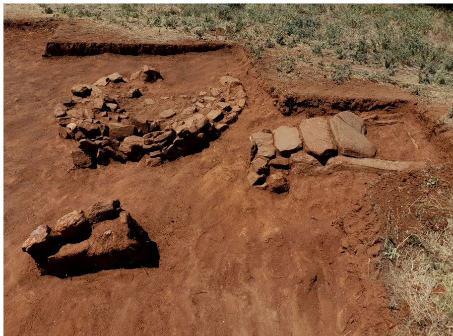
Ил.2 - Локалитетот Павла Чука, истражуван простор во 2020 година (поглед од север)