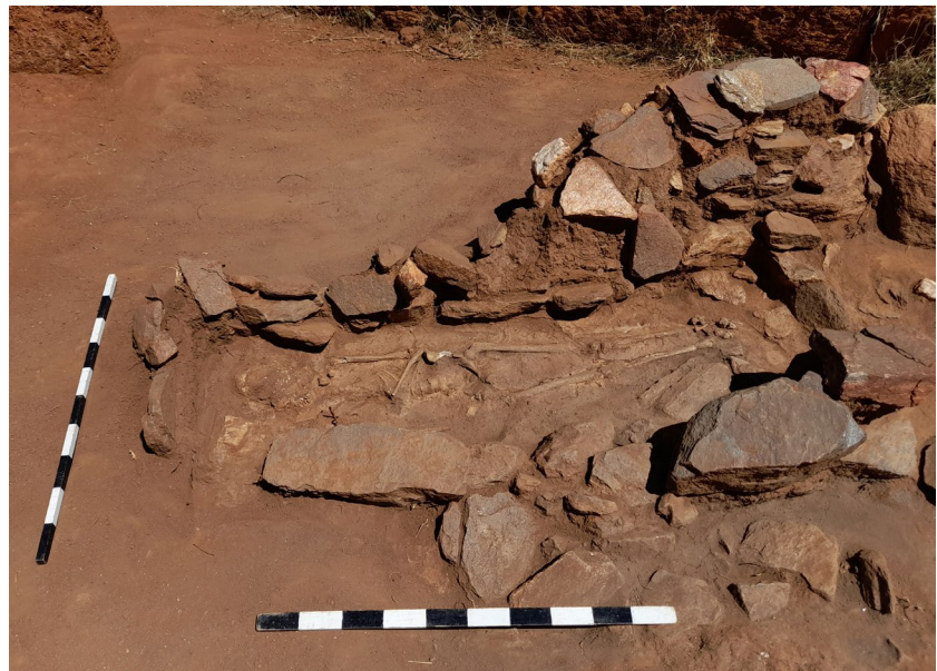
Ил. 3 - Гроб 13 (поглед од југ)