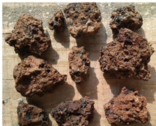
Ил. 10 - Печена глина евидентирана во Конструкцијата Fig. 10 - Baked clay registered in the Structure

Со истражувањата во 2020 година на локалитетот Павла Чука се потврди сознанието добиено претходната година дека на просторот од западната страна на дромосот на раноантичката