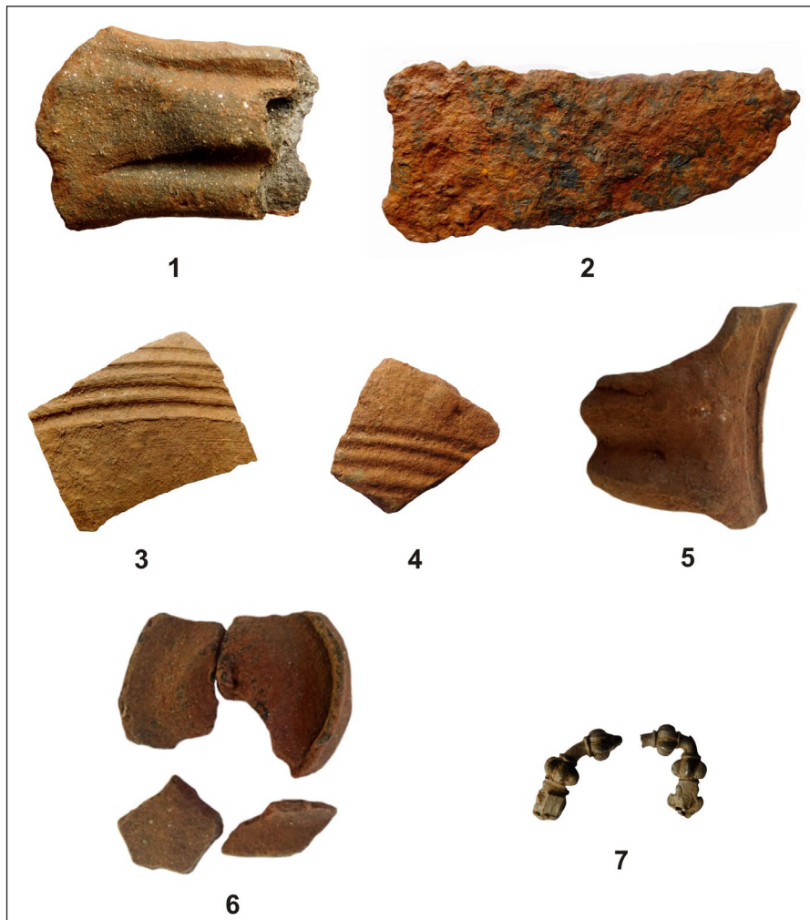
Табла III - Движни наоди (истражувања во 2020 година)

Plate III – Moveable finds (2020 research)