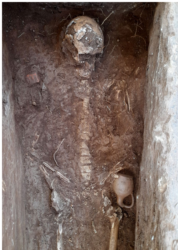
Ил. 7 - Гроб 15 - отворен (детал)