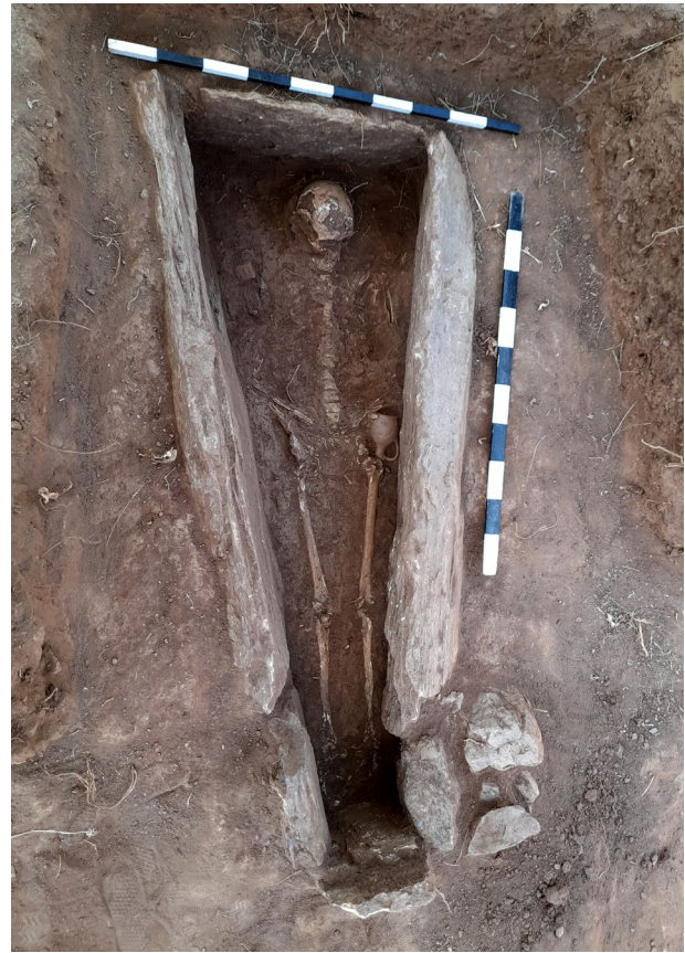
Ил. 6 - Гроб 15 - о̀творен (по̀зглед од исто̀к)

страна е оформена од, исто така, една камена плоча со поголема должина од 0,60 м, но помала дебелина од само 4 см. Се констатира дека гробот е на, речиси, исто висинско ниво со Гробовите 12 и 13. Со ископувањето на земјата во внатрешноста на конструкцијата, на длабочина од околу 0,40 м се најде на скелетните остатоци од покојникот. Главата во западниот поширок краен дел од конструкцијата беше благо спуштена кон север, додека ребрата, рацете и карлицата се сочувани во поретки фрагменти (ил. 6). Од движни наоди откриена е само една мала керамичка стомна покрај левата карлица (ил. 7, табла II). Садот има врат кој се стеснува во својот среден дел и се проширува кон издолженото полутопчесто тело, кое во долниот дел делува како да е пресечено со рамното дно. Од венецот кој е од типот на античките садови „оинохое“, поаѓа лентеста држалка и