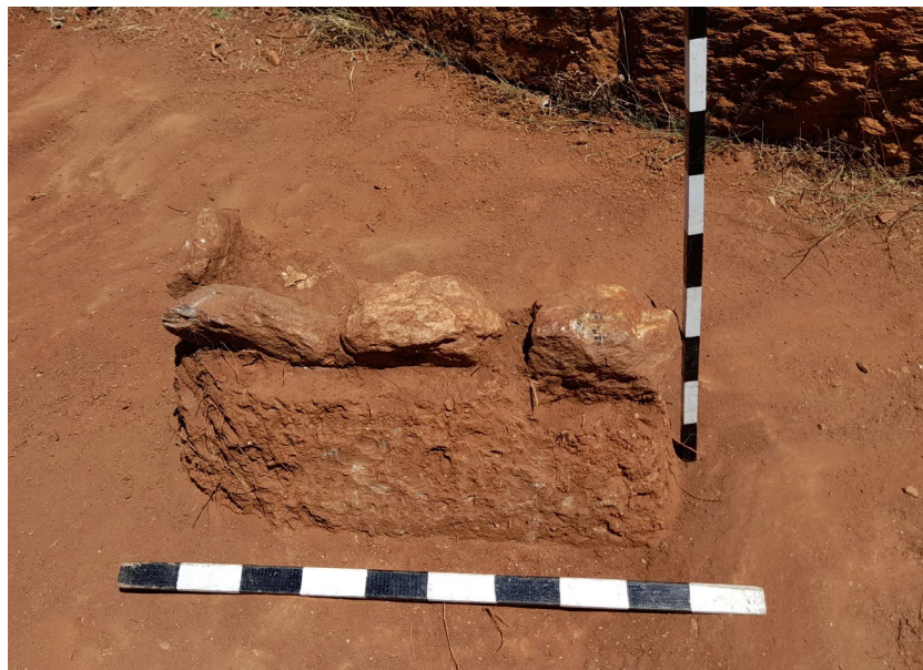
Ил. 4 - Гроб 14 (поглед од југ)