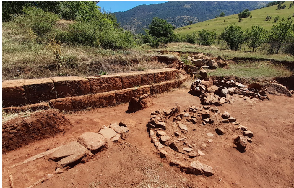
Ил. 1 - Локалитетот Павла Чука, истражувања во 2019 и 2020 година (поглед од север)