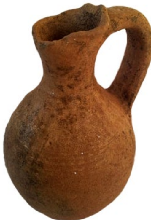
Табла II - Сџомна во Гроб 15

И оваа година е откриена конструкција за која исто како и за онаа откриена во претходната 2019 година, не може да се дефинира намената. Подигната е на околу 0,40 м југоисточно од Гробот 15, а евидентирана е неправилна кружна форма со димензии 2,48 м / 2,34 м (ил. 8). Нејзините ѕидови се градени од убаво делкани камења, некои со плочеста форма, а имаат најголема сочувана висина до 0,30 м, односно до четири реда камења. Во југозападниот дел евидентиран е прекин на оградувањето, додека во крајниот североисточен