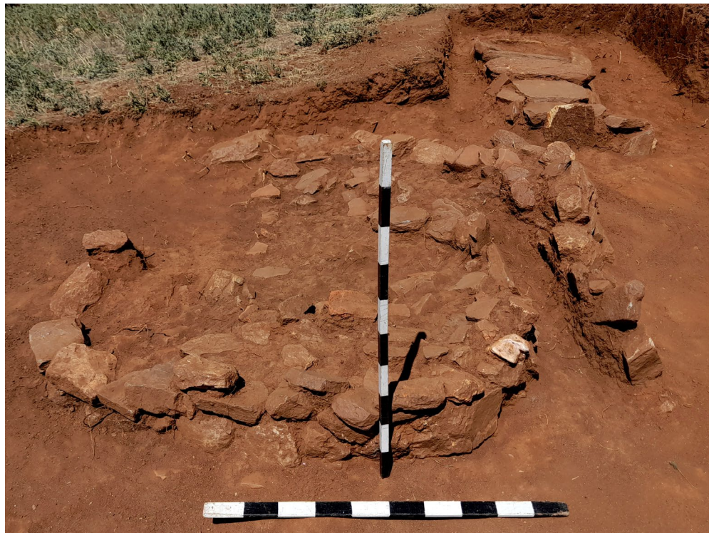
Ил. 8 - Конструкција и Гроб 15 (поглед од исток)