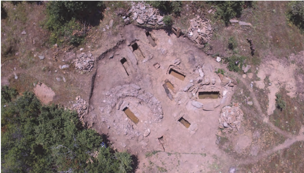
The excavated area in 2016

With these excavations, an area of about 400 m 2 has been explored, whereby 11 graves embedded in a rock and 6 burials in urns were found. The graves in the rock are about 2 m in length, with a width of about 0.70 - 0.80 m. and a depth of about 1 m. These embedded gravel pits are, without exception, covered with three to four processed flat stone slabs. Of the eleven graves the gravel pit of which was embedded in the rock, four were robbed by wild diggers. Although robbed they were cleaned and documented in order to apply the general plan of the necropolis and to determine the ratio of graves and their orientation.