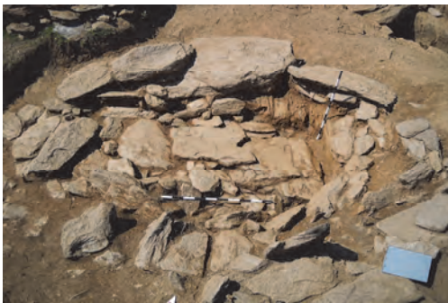
Grave with circular ring - closed

In this phase of research, we came to the conclusion that the earliest burial structures of the 4 th century BC also have a tomb circle - a ring formed of unprocessed larger stones that shape the circle around the burial hole, in which there are smaller unprocessed stones that formed a mogila - a tumba, a feature of the graves of previous periods, that is, iron time.