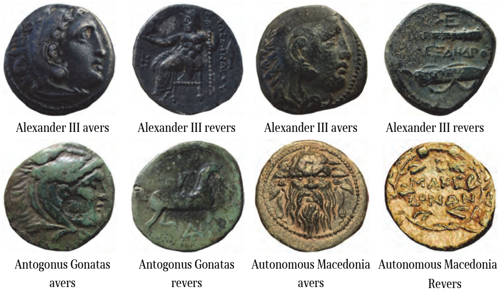
Some of the coins found during the excavations in 2016

the Republic of Macedonia 12 , one as part of the Tremnik depot 13 , which is very similar to the pyxis of Kale Lokveni, with the difference that it is made of gold, then another silver one, almost identical from Ždanec Skopje. 14 The richness of the findings, their luxury in the workmanship, the number of coins placed in the context of the monumentality of the performance of the mighty walls of the fortress, as well as the presence of monumental funerary architecture, such as the example in the second necropolis, with the aristocratic grave in the rock, 15 point not only to the wealth of the inhabitants of this fortress, but also to their communications with the Mediterranean world, which justifies the assumption of a higher level of organization and importance of the fortress, which can be said to have grown into a town.