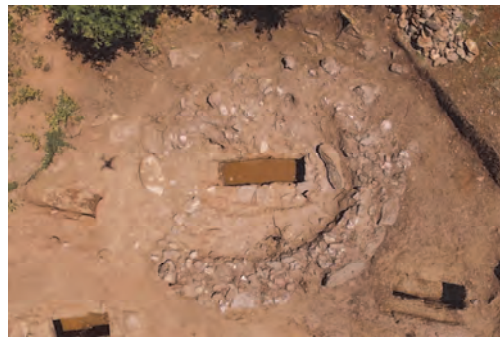
Grave with circular ring - opened