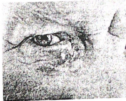
а. базоцелуларен карцином

73-годишен пациент со рецидивен базоцелуларен карцином на повеќе од 65 % од долниот очен капак и на медијалниот кантус. Постексцизиониот дефект со големина 2,5 x 1,8 см го реконструираме со комбинација на фронтална резенка и резенка од образот по Mustarde. Раната зарасна per primam.