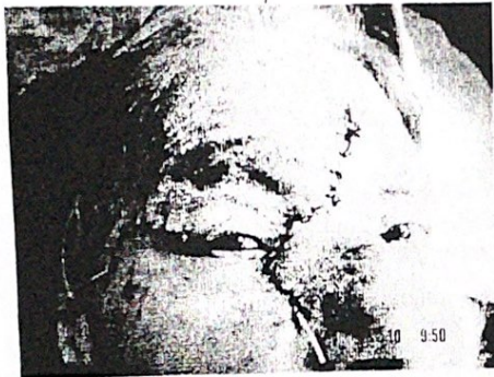
г. сошнени резенки