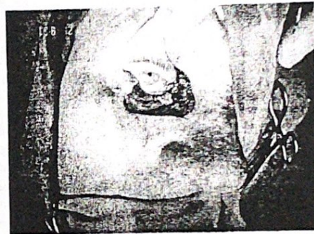
б. постексцизионен дефект