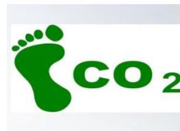
Слика U-1: Символ за јаглероден отпечаток

Со поставување ознака или во документацијата на производот, производителите ја наведуваат потрошувачката на електрична енергија на поединечен производ, што може да се користи за пресметување на јаглеродниот отпечаток. Индиректниот јаглероден отпечаток се однесува на сите производи или