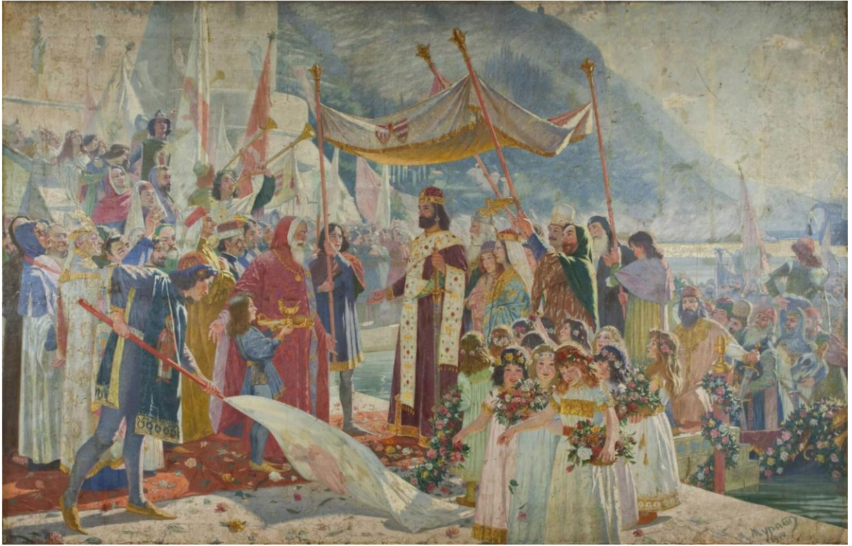
Слика бр. 1 Доаѓањето на цар Душан во Дубровник.*

Есента 1350 година Душан се упатил кон Солун и му испратил пратеници на Кантакузин со предлог да остварат средба и да го обноват мирот. Средбата меѓу Душан и Кантакузин се остварила во близина на Солун. Постигнатиот договор предвидувал Византија да ги задржи областите: Тесалија, Акарнанија, Сервија (ден. Серфице), потоа градовите: Верија, Воден, Гинекастро и Мигдонија и областите околу реката Струма до градот Сер, а Српското царство: Зихна, Сер, Мелник, Струмица, Костур и други градови и села во Македонија. Набргу по средбата Душан еднострано го раскинал договорот и започнал со освојувања во близина на Солун. По овие настани во Византија започнала нова Граѓанска војна помеѓу Јован Кантакузин и Јован V Палеолог кој во тоа време престојувал во Солун. Пролетта 1351 година императорот Јован испратил пратеници кај Душан за склучување воен сојуз за борба против Кантакузин. Сојузот бил склучен и Душан му ветил на Јован дека ќе му помогне да се врати на цариградскиот престол. Во овој период Душан испратил пратеници кај турскиот-османлиски султан Орхан I (1323-