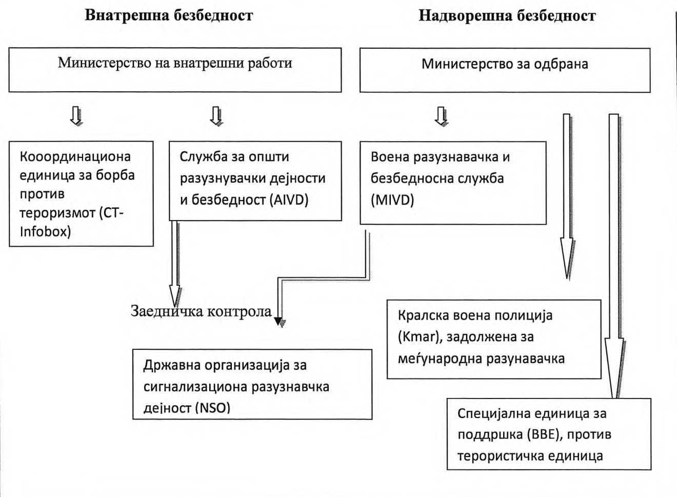
Видови на разузнавачки служби во одбрани европски земји

Пример за обединет разузнавачки сектор: Холандија