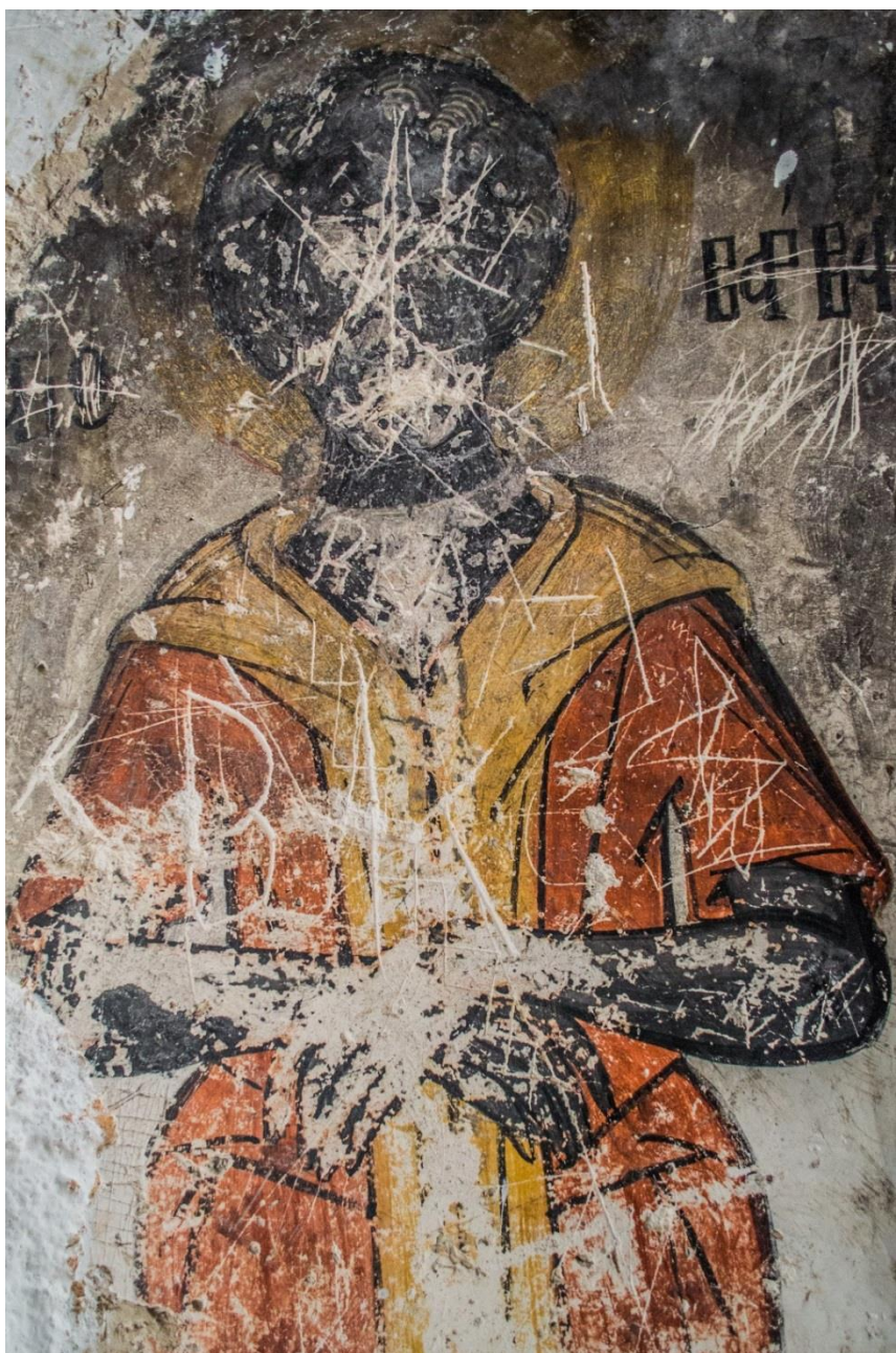
10. Свети Варвар од храмот Свети Атанасиј во Елатија (XVIII в.)