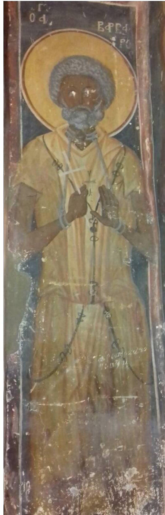
2. Свети Варвар од Лесновскиот манастир, 1349 г.