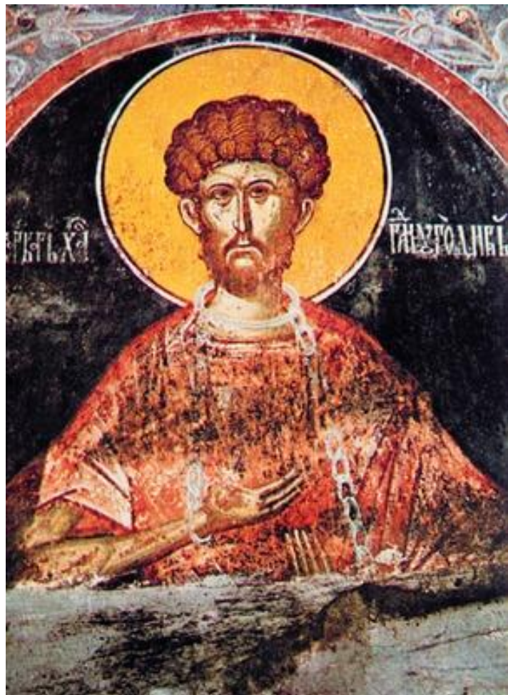
8. Свети Варвар од трлезаријата на манастирот Хиландар, 1622 г.