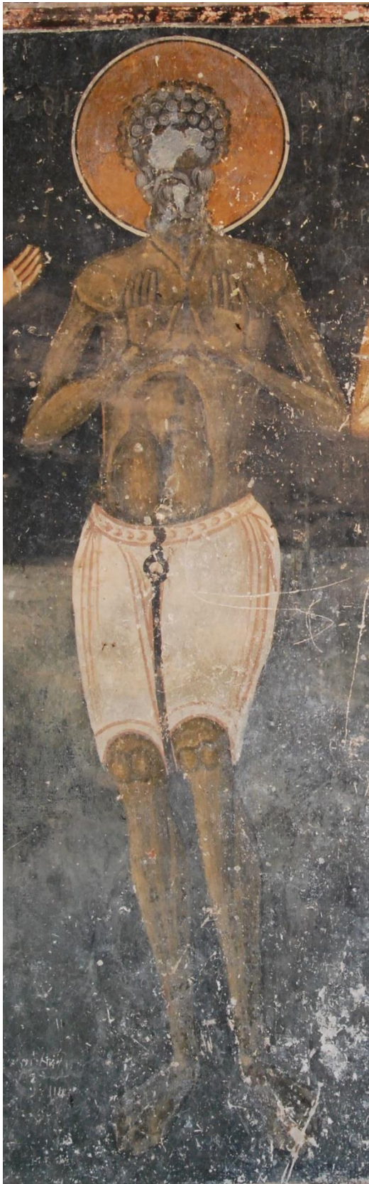
1. Свети Варвар од галеријата на храмот Света Софија во Охрид, 1346 – 1350 г.