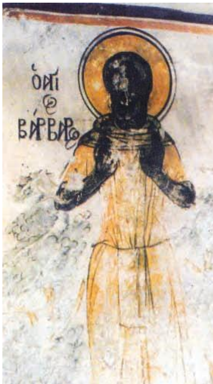
9. Свети Варвар од манастирот Свети Јован Крстител во Вомвоку кај Навпакт (XVIII в.)