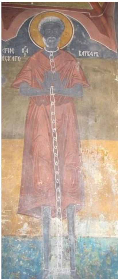
7. Свети Варвар од Слимничкиот манастир, 1606-1607 г.