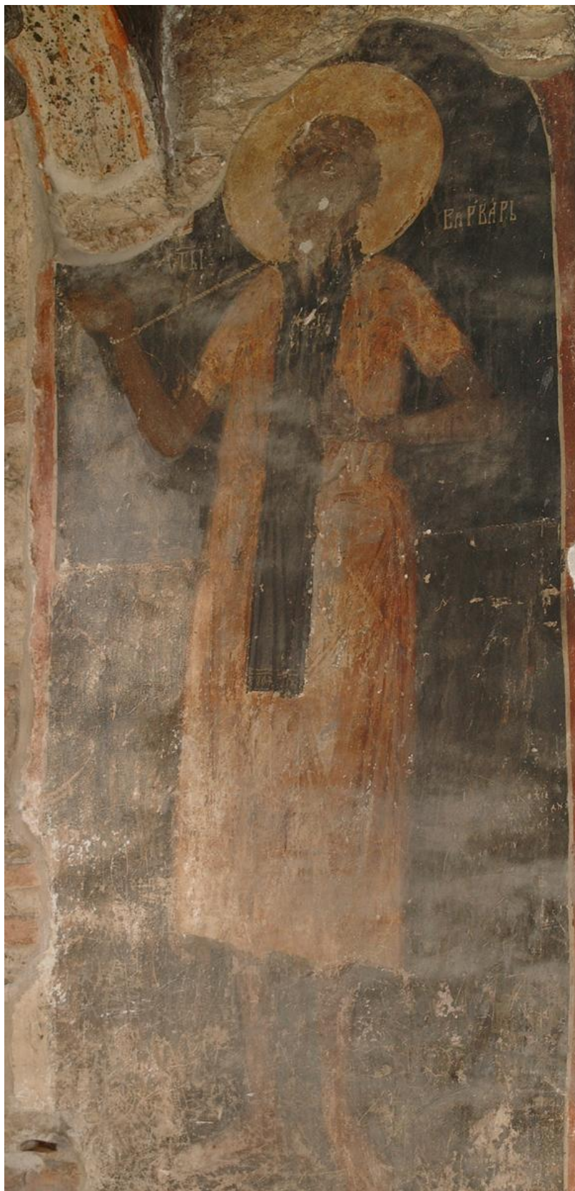
5. Свети Варвар од манастирот Грачаница, 1570 г.