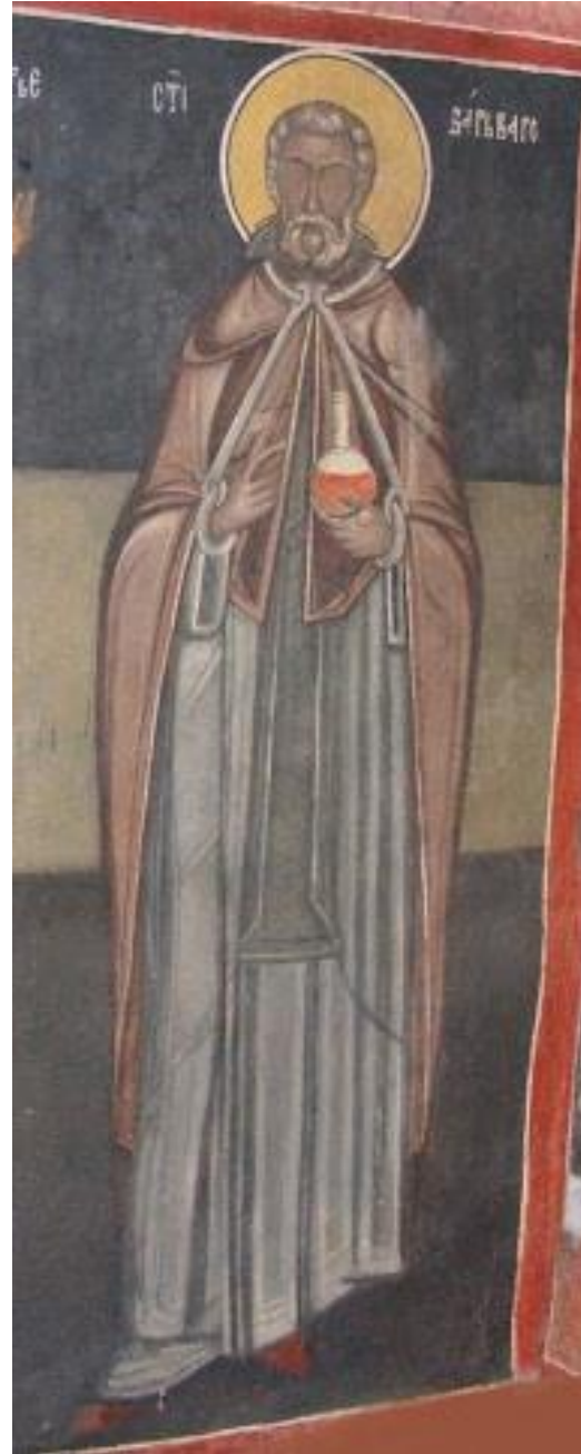
4. Свети Варвар од Кремиковскиот манастир, 1493 г.