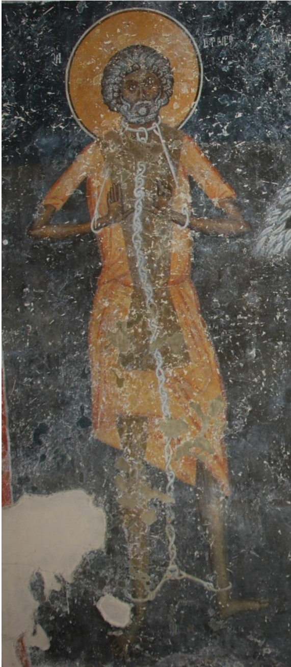
3. Свети Варвар од манастирот Зрзе , 1368-1369 г.