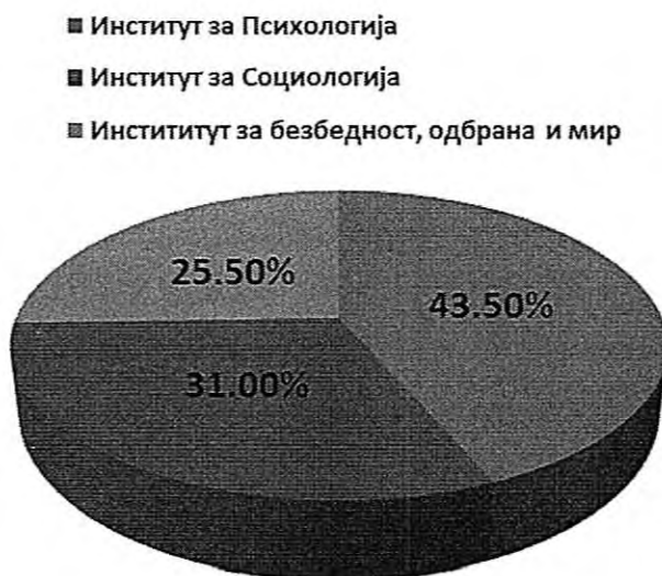
Слика 2: Дистрибуција на испитаниците по факултет на кој студираат

Според тоа на кој факултет студираат, 87(43,5% ) испитаници се студенти на Институтот за Психологија, 62(32,5%)се студенти на Институтот за Социологија и 51 (25,50%) се студенти на Институтот безбедност, одбрана и мир при Филозофскиот факултет во Скопје. Дистрибуцијата на испитаниците според факултетот на кој студираат е дадена во продолжени на Слика 2: