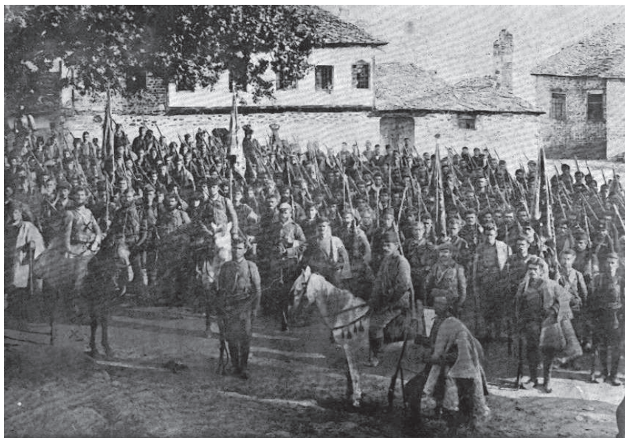
Македонски востаници во Клисуре

извори и расположливи материјали, можеме да заклучиме дека бројот на востаниците кои учествувале во ослободувањето на Клисуре се движел околу 600 луѓе. Бројката што ја изнел Попов се должи, најверојатно, на вкупниот број востаници кои наредниот ден се собрале во градот. Имено, тој ден пристигнале и селските чети од В'мбел и од Куманичево. 633