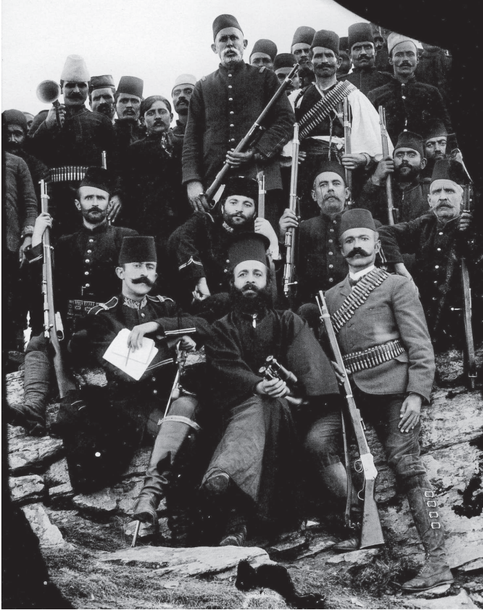
Германос Каравангелис фотографиран со османлиска војска

на востанието, напишал дека „не се прави никаква разлика меѓу нашите (патријаршистите, б.н.) и шизматичките села кога станува збор за (...) палењето на селата“. 700