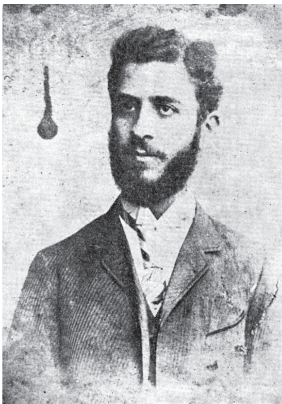
Германос Каравангелис – Лајпциг (1881-1891)

1888 година се запишал на Филозофскиот факултет во Лајпциг. Престојот во Европа извршил големо влијание врз интелектуалното надградување на Каравангелис, пред сè со изучувањето на општата и на црковната историја и на филозофијата. Во 1891 година тој се стекнал со титулата доктор по филозофија. Истата година Каравангелис бил назначен и за професор во Теолошкото училиште во Халки. Тука предавал црковна историја и други теолошки предмети, а својот престој во училиштето го завршил во 1896 година, кога од страна на патријархот Антимос VII бил назначен за митрополит на Перан. 20 Во тој дел од градот биле сместени голем број странски амбасади. Во ова опкружување се испреpletувале интересите на разни религиозно-училишни пропаганди институции во Османлиската Империја.