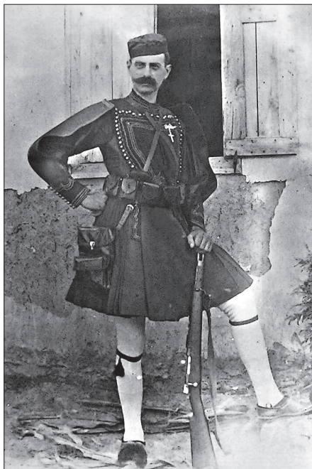
Павлос Мелас (1870 – 1904)

Соработката на оваа неформална група започнала набргу по пристигнувањето на Драгумис, кој ја претставувал алката на поврзување на идејата за грчка вооружена борба против македонското револуционерно движење, во Битола. Тој ја вршел кореспонденцијата и координацијата меѓу националистичките групи во османлиска Македонија и Кралството Грција. Од друга страна, Драгумис и Мелас во Каравангелис пронашле личност преку која се надевале дека полесно ќе ги реализираат плановите за создавање месни платенички вооружени чети, но и за испраќање паравоени групи од грчката држава во Македонија. Исто така, и Каравангелис, по неуспешните обиди да предизвика внимание кај официјална Атина, конечно пронашол грчки ултранационални дејци, преку кои сметал дека полесно ќе ги реализира плановите, а истовремено се стекнал и со финансиска, морална и со техничка поддршка за претходно започнатата дејност. Така, активистите од