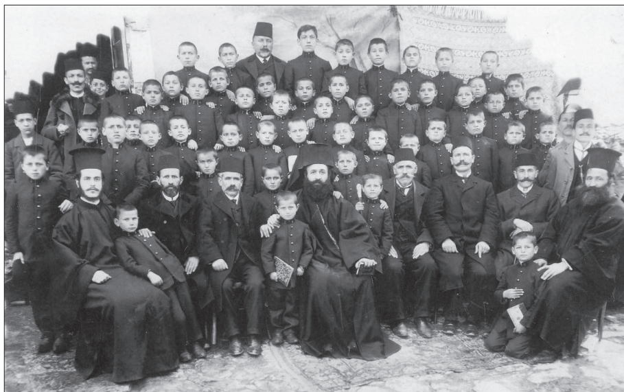
Фотографија на Германос Каравангелис со штитеници во неговото сиропиталиште

целите на оваа институција била и воспитувањето во грчки дух на децата на убиените месни соработници и шпиони на митрополитот. Низ ова сиропиталиште поминале околу 70 македонски деца. Нивните денови, според Каравангелис, минувале на следниот начин: „децата се хранеа и преноќуваа таму (во сиропиталиштето, б.н.), преку денот учеа во грчки училишта во Костур“. 758 Откако ќе го завршеле образованието во Костур, тие најчесто биле испраќани во Кралството Грција и со државни пари биле запишувани на воени училишта или на универзитети.