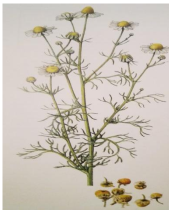
Slika 3. Kamilica ( Matricaria Chamomilla L.) (Kišgeci, 2008).