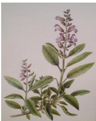
Slika 6. Kadulja ( Salvia officinalis L.) (Kišgeci, 2008).

Figure 6. Sage ( Salvia officinalis L.) (Kišgeci, 2008).