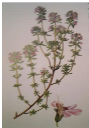
Slika 7. Majčina dušica ( Thymus serpyllum L.) (Kišgeci, 2008).

Figure 7. Thyme ( Thymus serpyllum L.) (Kišgeci, 2008).