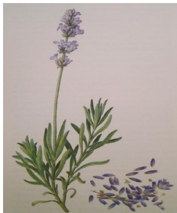
Slika 1. Lavanda ( Lavandula officinalis Mill.) (Kišgeci, 2008).