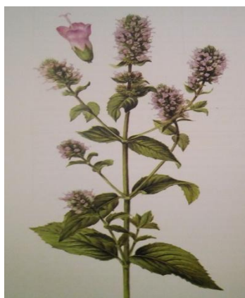
Slika 4. Paprena metvica (menta) ( Mentha x piperita ) (Kišgeci, 2008).