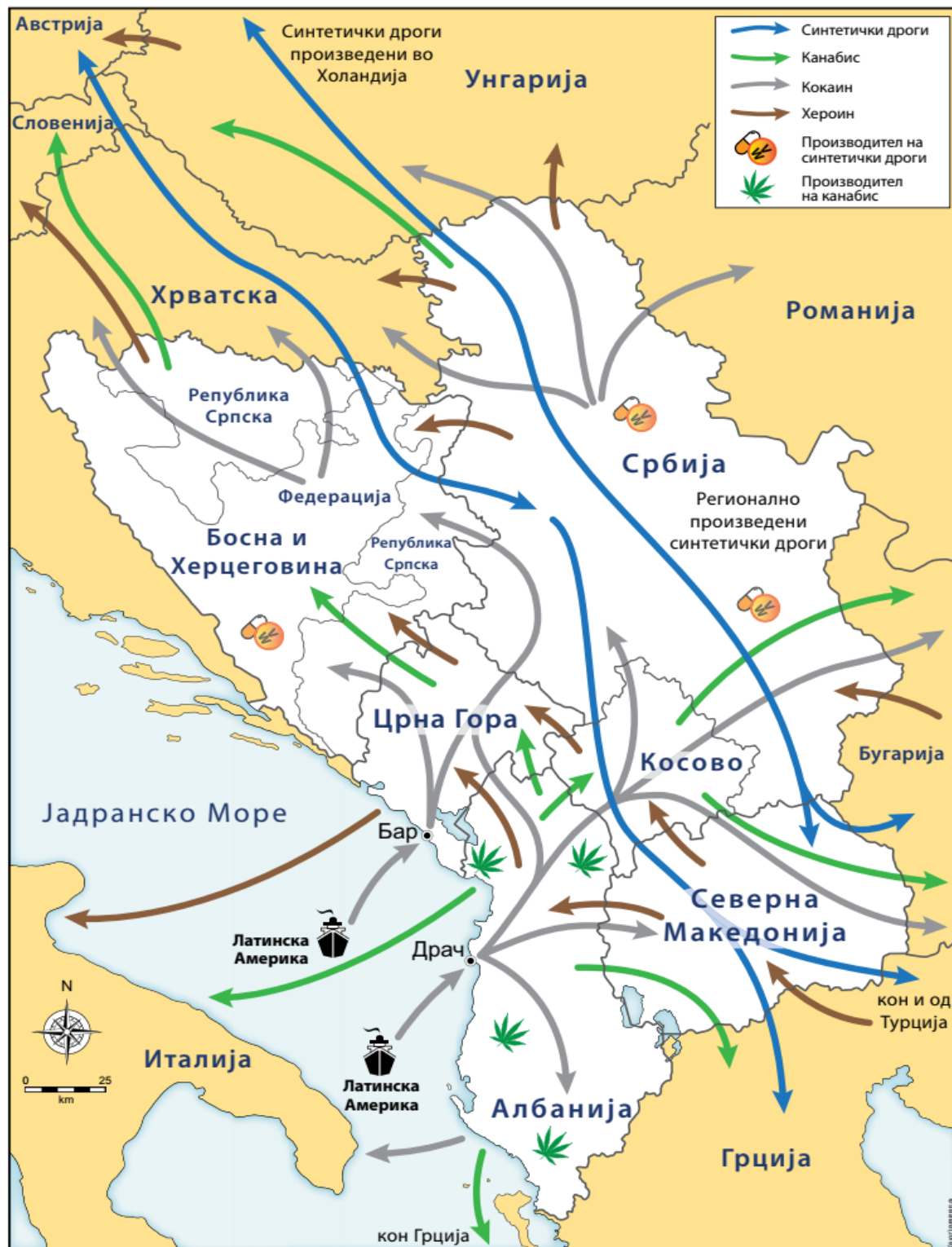
Мапа 1: Регионални недозвољени текови