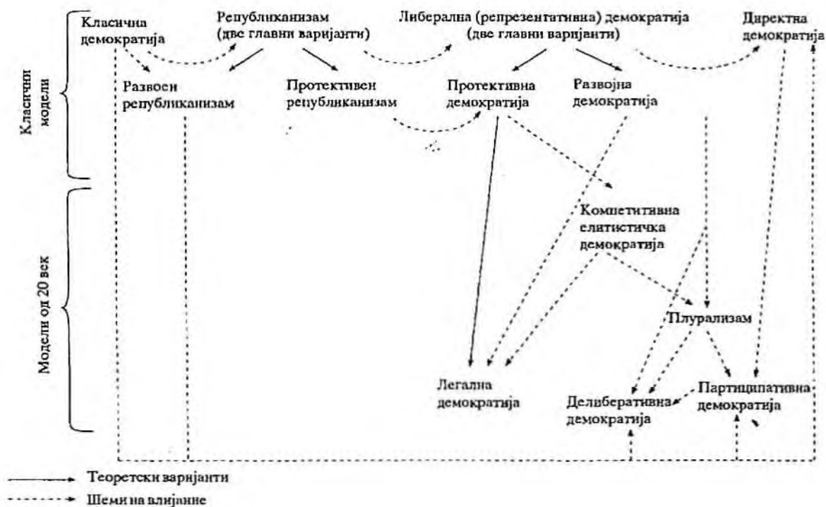
Слика 1. Варијанти на демократијата

Сосема свесен за проблемот на редуktivноста при ваквото изложување на развојот на размислите за демократската практика и нивно временско вкалапување, Хелд се обидува графички да ја заокружи замислата за формирање на Мапа на развојот на теориите за демократија, во која јасно се читуваат влијанијата и насоките на развој.