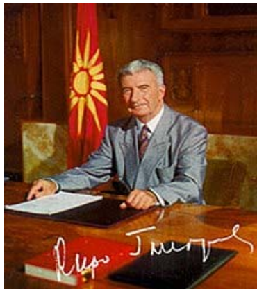
Киро Глигоров (1917 - 2012)

Киро Глигоров (1917 - 2012) роден во Штип, завршил на Правниот факултет во Белград. Учесник во НОБ, секретар на Иницијативниот одбор за подготовка на Првото заседание на АСНОМ. Бил избран за народен претставник на заседанието, секретар на АСНОМ. По војната извршувал многу функции, како сојузен секретар за финансии, потпретседател на Сојузниот извршен совет, член на Извршното биро, на Претседателството на ЦК СКЈ и претседател на Сојузното собрание. Киро Глигоров беше претседател на Република Македонија во два мандата кој траеше од 1991 година до 1999 година кога се повлече и своето слободно време го посвети во пишување и објавување на многу монографии. Киро Глигоров ќе биде запаметен во македонската политика како најстар и најпознат македонски политичар во современата историја на парламентаризмот. Кога на 17 ноември 1999 заврши неговиот втор мандат на 82 години старост, Киро Глигоров беше запишан во Гинисовата книга на рекорди во 2000 година како најстар претседател на држава во светот. Киро Глигоров почина во Скопје на 01 јануари 2012 година во својот дом во Скопје.