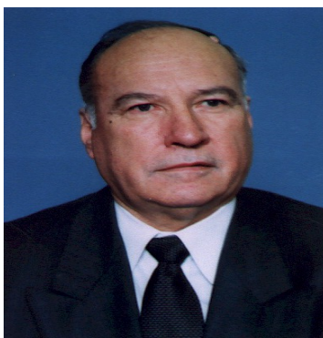
Стојан Андов ( 1934 - )

Уште на првата седница се појавија многу нерешливи прашања, почнувајќи од прашањето која химна да се интонира, верификацијата на мандатите на пратениците и кој да се избере за претседател на Собранието.