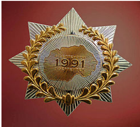
Орден 8 Септември

Со изменетата одлука за орденот 8 септември, за првпат се додели на 17 ноември 2006 година на Роберт Бадинтер од Франција, како прв странец одликуван со македонско одликување. Орденот му е врачен на 23 октомври 2007 година во Париз на свеченост организирана во македонската амбасада од страна на претседателот Бранко Црвенковски.