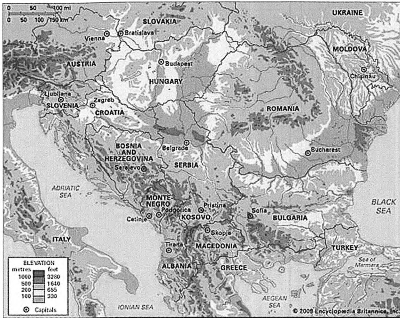
Слика 1 Карта на Балканскиот Полуостров, Извор: Encyclopædia Britannica Online. Web. 28 Feb. 2018

доаѓаат до морето. Во северниот дел на Балканот се Карпатските Планини, кои достигнуваат доста големи височини во Трансилванија, западниот дел на Романија. Постојат многу други помали граници на планините и ридови.