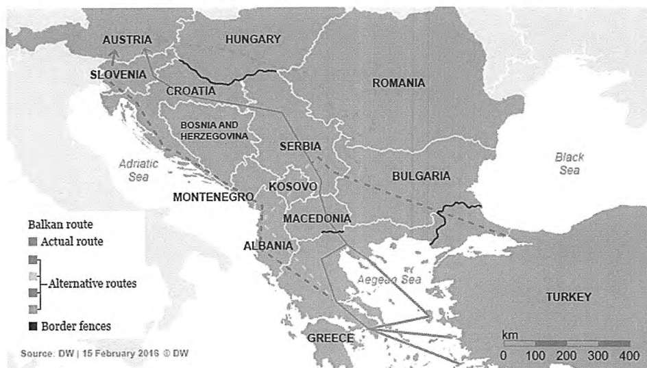
Слика 3 Балканската рута

Иако имало многу различни миграциски рути активни пред 2015 година, начинот на кој беше активна Балканската рута помеѓу летото 2015 и пролетта 2016 беше уникатен. Пред 2015 година, присилните мигранти го преминуваа Средоземното Море за да стигнат до Италија и ЕУ со чамци и бродови. Во април 2015 година околу 800 присилни мигранти се удавија во бродолом веднаш до либискиот брег. По овој бродолом, Европската комисија ја претстави агендата на ЕУ за миграција и операција Софија. Главната цел на операцијата Софија беше да се пресретнат и уништат бродовите кои шверцерите со луѓе ги користеа за преминување на Медитеранот. Операцијата Софија имаше несакан ефект: го пренасочи патот на бегалците по рутата која минува низ Западен Балкан до многу поголем степен. Рутата на Западен Балкан беше посебна, бидејќи од септември 2015 година до март 2016 година, земјите на оваа рута имено Грција, Македонија, Србија, Босна, Хрватска и Словенија го олеснија транспортирањето на присилните мигранти кон најпосакуваните дестинации.