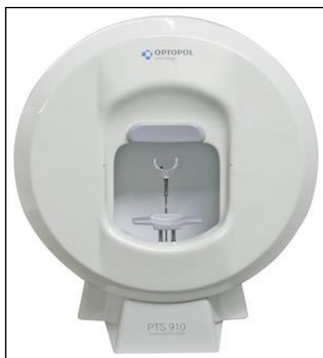
Слики 1 и 2. Стандардна компјутеризирана периметрија тип Оптопол ПТС 910

Дефиницијата на Европското глаукомско здружение промовирана во 2014 година (EGS 2014) гласи: „Глаукомот е хронична прогресивна оптичка невропатија со карактерни морфолошки промени на дискот на оптичкиот нерв и ретиналниот неврофибриларен слој како и прогресивна смрт на ганглиските клетки со загуба во видното поле, при отсуство на други очни болести и конгенитални аномалии“. Оттука покрај стандардните методи кои досега ни беа на располагање, како мерење на висината на интраокуларниот притисок (ИОП), гониоскопија, преглед на очното дно, како и одредување и следење на видната острина, неопходна стана потребата од стандардната компјутеризирана периметрија и оптичката кохерентна томографија на задниот очен сегмент. Во оваа прилика покомплексно ќе се задржиме на стандардната компјутеризирана периметрија, нејзиното значење и нејзините можности во раната дијагностика на глаукомот.