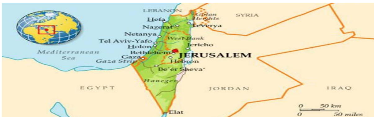
Приказ на територијата на Палестина

Палестинското население е арабизирано, зборувајќи го арапскиот јазик, ја практикува таа култура и исламот како најмасовна религија. Муслиманите владееле таму се до победата на Британците над Отоманците во Првата Светска Војна, кога Британците ја преземаат Палестина.