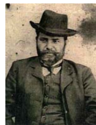
Петар Поп Арсов

1. Македонското револуционерно движење се овоплоти врз сепаратизам кој се пројави во текот на 19 век како израз на македонските јазични, културни и етнички особености. Меѓу првите кои пишува и ја осудија оваа усилба беше и цариградскиот весник „Право“. Во ноември 1870 година, споменатиот весник ја објави статијата „Една вистина“ во која се забележува: „Во текот на 1868 год. еден Македонец издаде неколку книги... Тие книги, наместо полза, донесоа штета во местата, каде г-н К. А. Шапкарев успеал да се воведат“. Според весникот, овие книгите не само што ги помрачиле умовите на децата, дури и јазикот кој бил употребен во нив имал мала цена во Македонија. Според „Право“: „Тоа наречје е чисто охридско, кое што не во употреба во другите македонски градови. И навистина, Македонија се состои од следните поглавни градови: Солун, Битола, Велес, Прилеп, Штип, Скопје и др. Славејков не го вброил Охрид меѓу македонските градови, бидејќи според него тој бил во Албанија, а не во Македонија. Но што прави г-н К. А. Ш - в? Ја познава ли својата грешка? И дали влезе во кругот на мирот! - Не. Тој како беден учител во Кукуш ја оставил својата служба кога сакал, одел од град во град за да проповеда крстоносен поход против книгите од словено бугарски јазик кој биле воведени за учениците во училиштата и проповедал дека употребените зборови во тие книги биле црни букви и најгласни зборови“. 544