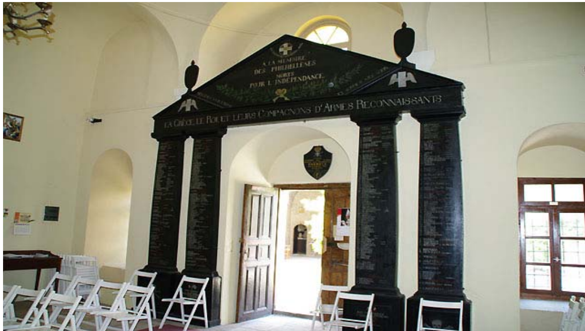
Римокатоличка црква во градот Навплион, позната како „Франкоклисиа“