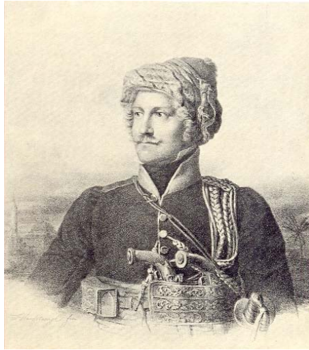
Мајор генерал Томас Гордон (1788 - 1841), британски воен офицер и историчар