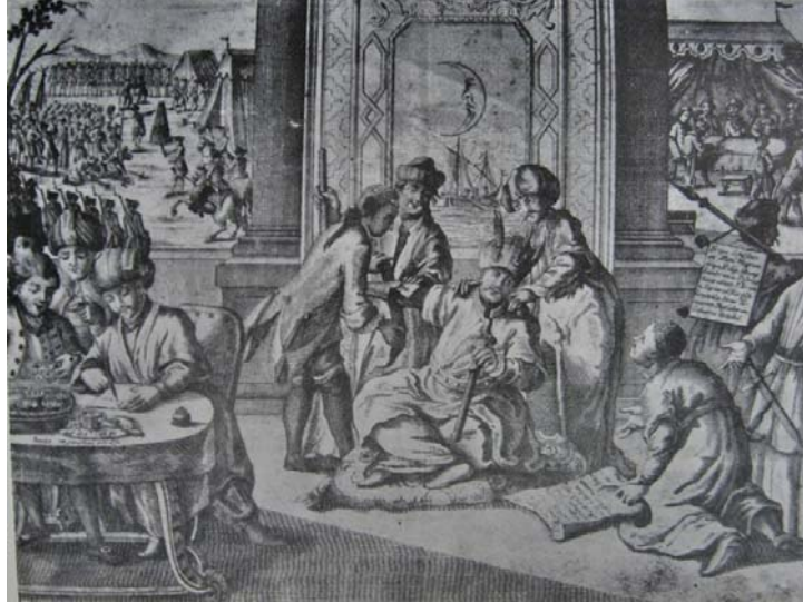
Гравура од потпишувањето на мировниот договор во Кучук-Кајнарџа

било правото на Русија „да изгради православна црква во Истанбул и да ги застапува и претставува пред османската власт оние кои служат во неа“. 4