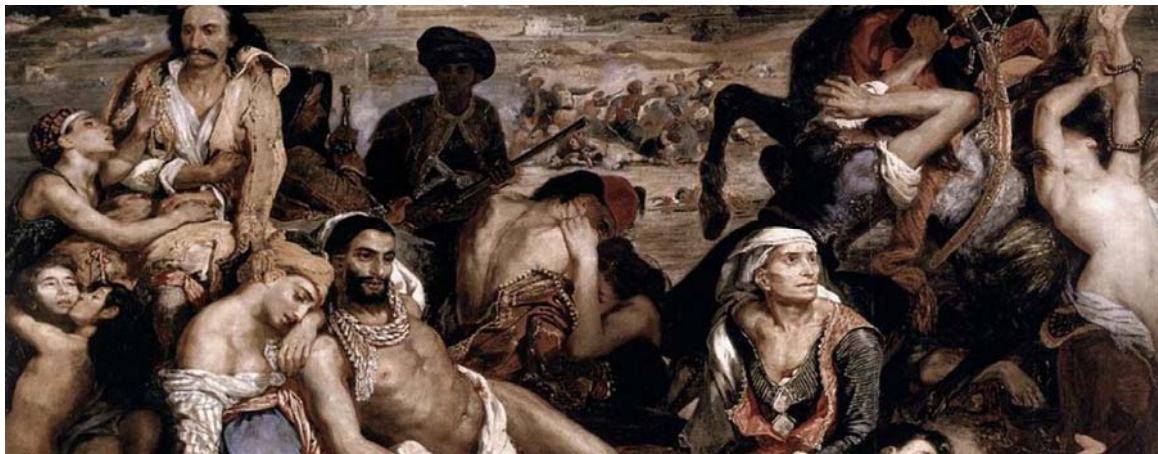
Ежен Делакроа „Сцени од масакрот на Хиос“

Настаните на Хиос предизвикале голема вознемиреност во политичките кругови во официјален Лондон. Таква реакција се забележува во една депеша која му ја испратил секретарот за надворешни работи на Велика Британија, Каслреј, до британскиот амбасадор во Цариград од 9 јули 1822 година. Секретарот потврдил дека ги примил депешата од британскиот амбасадор „кои пренесувале болен и одвратен рецитал од крвави сцени изникнати од војната на Хиос“ и за кои тој рекол дека му биле пренесени на кралот 82 . Егзекуциите на невините заложници од Хиос во Цариград ги загрижувале Каслреј и кралот, иако тие не биле во никаква смисла под заштита на Велика Британија. На амбасадорот Странгфорд му било наложено да пренесе остра порака до османлиските власти: „Со повторување на такви злосторства, тие не само што ќе ги направат сите мировни планови неприменливи туку ќе ги одвратат сојузничките држави од пријателство. Нема да има друга алтернатива од тоа да не дејствуваат повеќе преку нивните мисии и како што изгледа да се прифаќаат сведоштвата од извештаите во кои за (извршените м.з.) престани врз луѓето не може да се смисли изговор, уште помалку оправдување. И кои ако се повторат, мора да се изврши притисок на Советот на државата која ги толерира, со прекор кон најкрволочниот варваризам исполнет со омраза“. 83