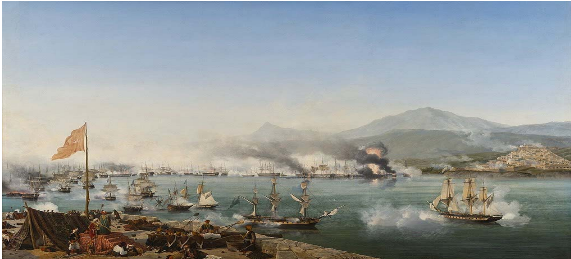
Битката кај Наварино, 20 октомври 1827 г.

Во јануари 1828 година на власт во Велика Британија дошле радикални ториевци на чело со војводата од Велингтон, кои изразиле став дека „погрешно било да се уништи флота на земја со која Англија не била во војна за каузата на грчката независност за која тие имаа малку симпатии“. 118 Дури и кралот во своето обраќање пред парламентот изразил жалење за случувањето на оваа битка, која била потполно неочекувана за него. Противниците на Кодрингтон во парламентот го обвинувале дека не направил доволно за да го заштити грчкото население така што египетски бродови заминувале со жени и деца кои биле продавани како робови во Александрија. Во јуни 1828 година, адмиралот бил отповикан од својата должност со заповед да се врати во Лондон.