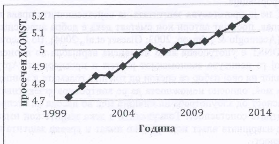
Слика 1: Просечни годишни вредности на XCONST (период: 2000 – 2013г.)