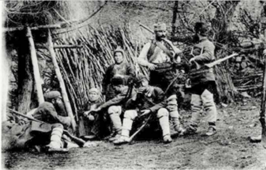
Abb. 1: Makedonische Revolutionäre während des Ersten Balkankrieges im Jahre 1912. Bilder wie diese prägten die romantischen Vorstellungen der Deutschen vom Kampf der »Inneren Makedonischen Revolutionären Organisation« gegen den Staat Jugoslawien in der Zwischenkriegszeit.

Parallel dazu wurde der deutsche Buchmarkt von 1918 an mit einer Flut makedonienbezogener Literatur des Kriegsmemoirengenes überschwemmt, ergänzt um Kriegsromane, von den dreißiger Jahren an dann auch von Kriminal- und Abenteuerromanen mit makedonischen Bezügen. 18 Hinzu kamen zahlreiche landes-