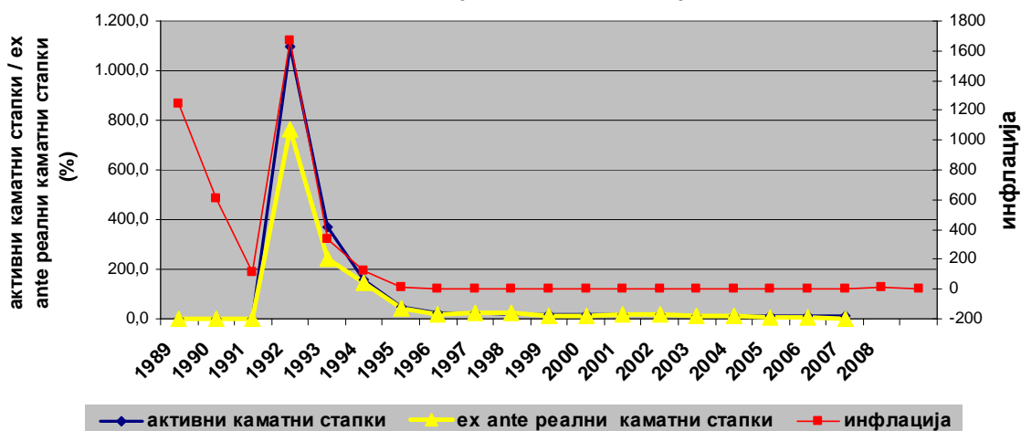
Движењето на активните каматни стапки, ex ante реалните каматни стапки и инфлацијата во Р. Македонија