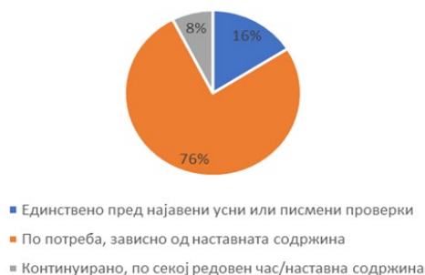
График 1. Користење дополнителна помош.

содржина (високи 76%), наспроти континуираното тунторство застапено само со 8%, (График 1.).