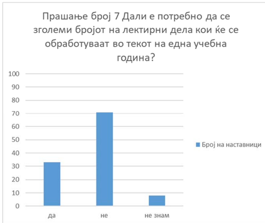
Графикон број 4: Оптимална бројност на лектирни дела во текот на една учебна година

Речиси 63,39% од наставниците сметаат дека актуелниот број на лектирните дела во една учебна година не треба да се менува. Речиси половина од овој процент на изјаснети наставници сметаат дека бројот на лектирните дела кои се третираат во една учебна година треба да се зголеми. Доколку овие податоци се поврзат со претходно добиените податоци, при испитување на статусот на лектирните дела во наставата според кои за еден месец од учебната година не се третира ниту едно цело литературно дело, произлегува дека лектирните дела и нивната анализа во наставата, наставниците го доживуваат како додатно оптеретување при работата. Се чини дека ова е загрижувачки податок, бидејќи наставниците треба да бидат основни мотиватори за развој на интересот за читање кај учениците.