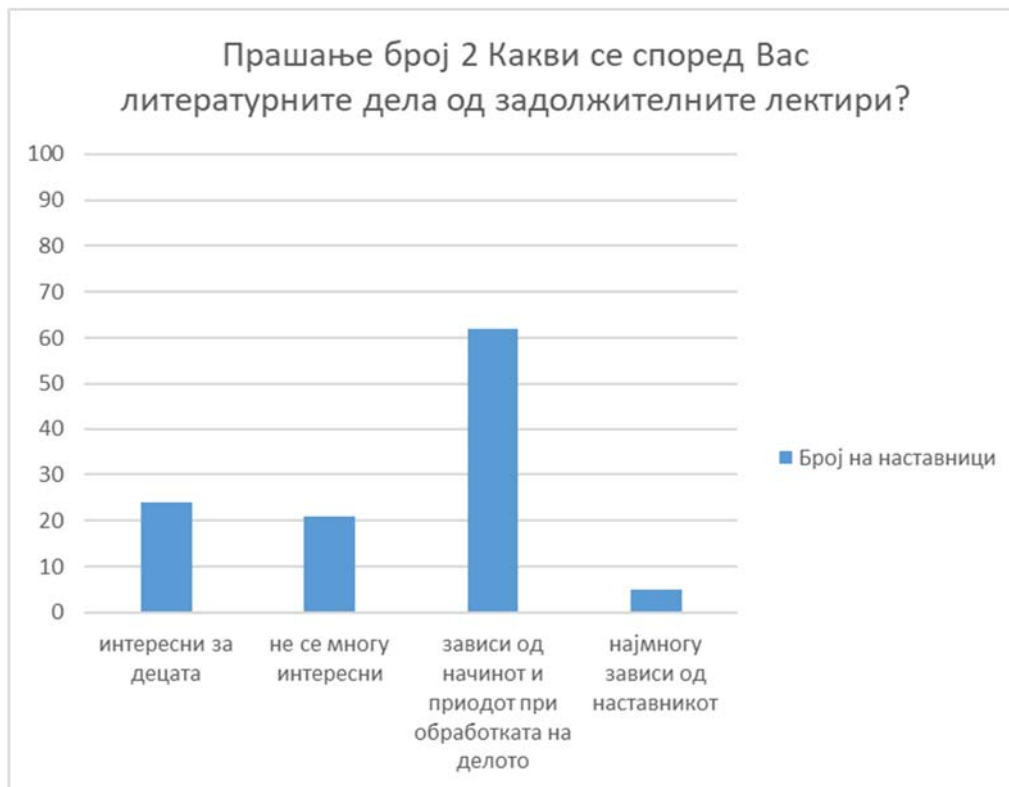
Графикон број 2: Интересот за читање на задолжителните лектирни дела

Според податоците прикажани на графиконот број 2 евидентно се гледа дека дури 55,36% од наставниците сметаат дека интересот на учениците за читање на задолжителната лектира е директно поврзан со начинот и пристапот кон лектирното дело. Тоа индиректно би значело дека со оглед на одговорот на претходното прашање, креативноста на наставникот којшто користи интересни, креативни пристапи, пристапи адаптирани на интересите и потребите на учениците за обработка на делото го зголемува интересот за читање на лектирните дела.