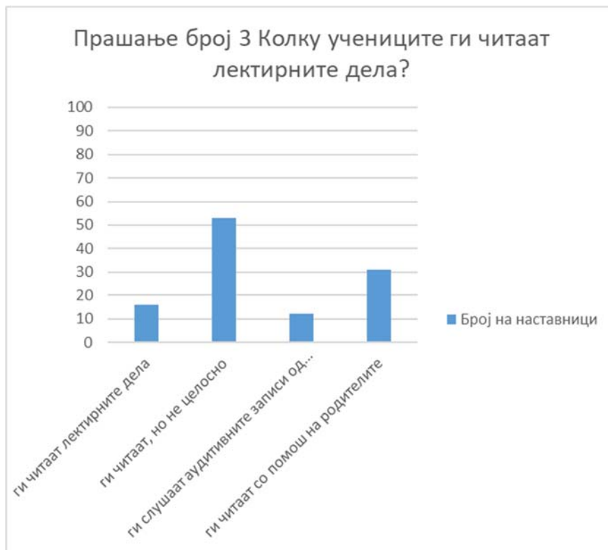
Графикон број 3: Читаност на лектирните дела

Најголем дел од наставниците, речиси 50% сметаат дека учениците ги читаат лектирните дела, но не целосно. Односно, тие прескокнуваат одредени делови, не го читаат крајот и слично. Се чини дека е нереален процентот на оние наставници (10,71%) кои сметаат дека учениците ги слушаат аудитивните записи на лектирните дела од Интернет, што според наше мислење е далеку од реалната состојба. Многу е голем процентот (речиси 30%) на наставници кои сметаат дека учениците лектирите ги читаат со помош на нивните родители, што пак, укажува на фактот дека не постои внатрешна мотивација за читање на лектирните дела.