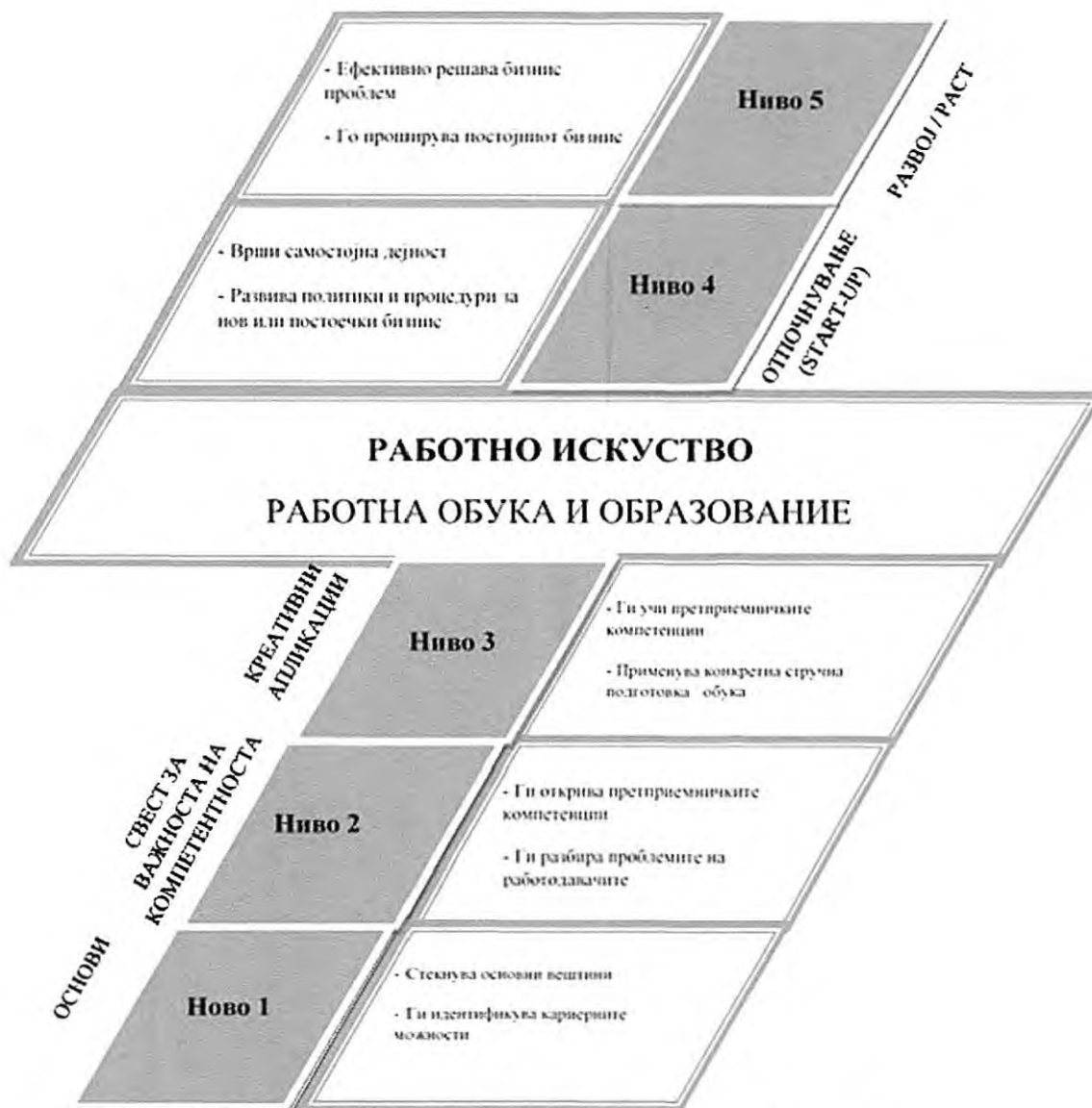
Сл. 5. Модел на доживотно претприемничко образование