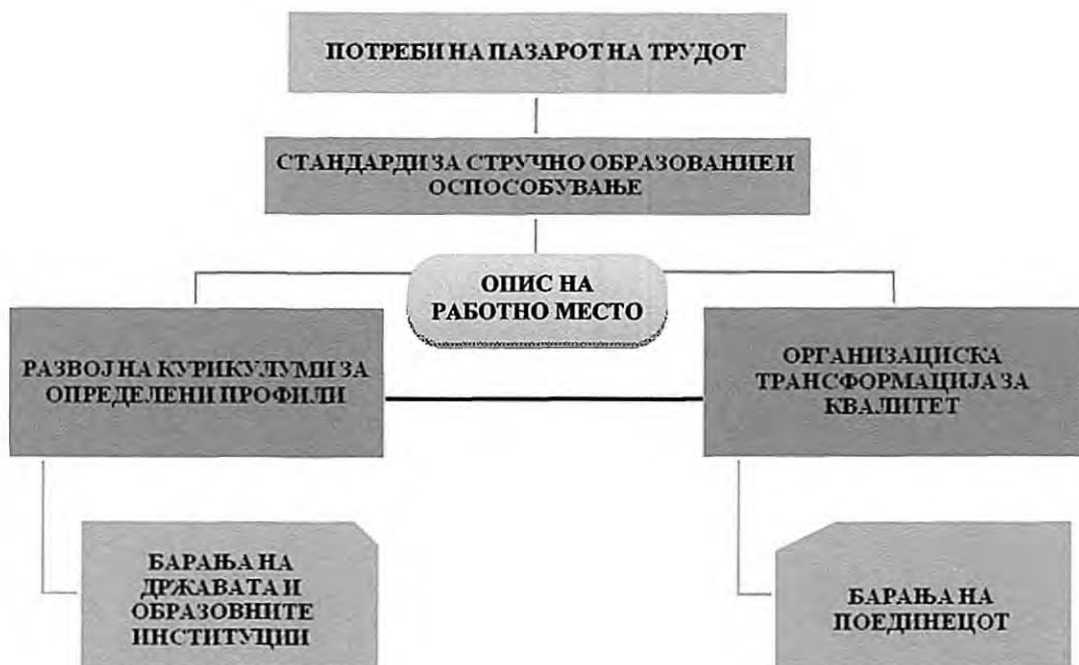
Сл. 4. Реформа на стручното образование 152

Потребите на пазарот на трудот кои се добиваат со спроведување на истражувања најчесто се однесуваат на потребните знаења, вештини, компетенции, ставови, однесувања. Барањата на државата и образовните институции всушност се однесуваат на општествените потреби искажани преку социјалните вештини какви што се комуникациските вештини, лидерството, тимската работа, животните вештини. Барањата на поединецот ги отсликува персоналните потреби какви што се информациско - комуникациската технологија, претприемништвото и странските јазици. Улогата на социјалното партнерство е да ги интегрира стандардите и курикулумот во согласност на овие три барања и да ја промовира парадигмата за учењето за цел живот.