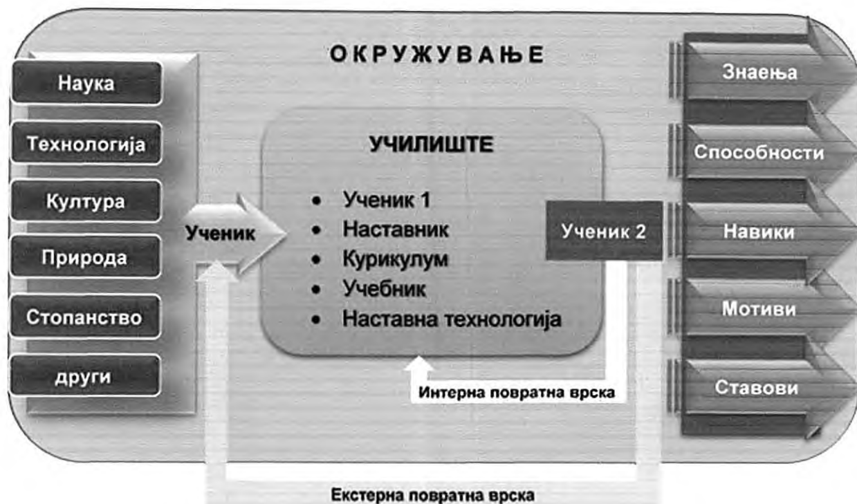
Сл. 2. Повратна врска меѓу училиштето и неговото окружување

Бидејќи окружувањето на училиштето брзо се менува, границите на училиштето како систем и неговото окружување стануваат се послаби и се рушат високите бедеми со кои се уште се опкружени образовните институции. Навистина, тоа оди многу споро, но сигурно и неизбежно. Проблемот е во тоа што училиштата слабо го познаваат своето окружување и ретко го следат, а уште поретко го проучуваат. Според тоа, целосното „отварање“ може успешно да го направат само оние училишта кои ќе бидат способни селективно да ги примаат променливите влезни елементи од надворешниот свет, но и со своите излезни елементи ќе влијаат на промените на окружувањето. Тоа е всушност организација со висок степен на функционалност.