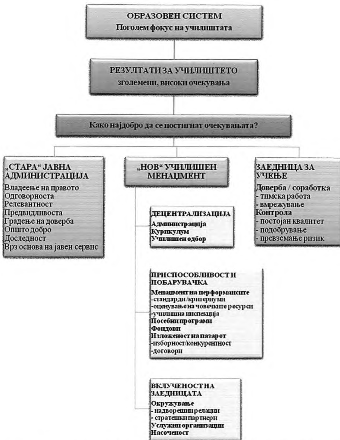
Сл. 1. Различните пристапи на менаџмент кои се користат за да се постигне зголемено очекување на училиштата и нивните лидери