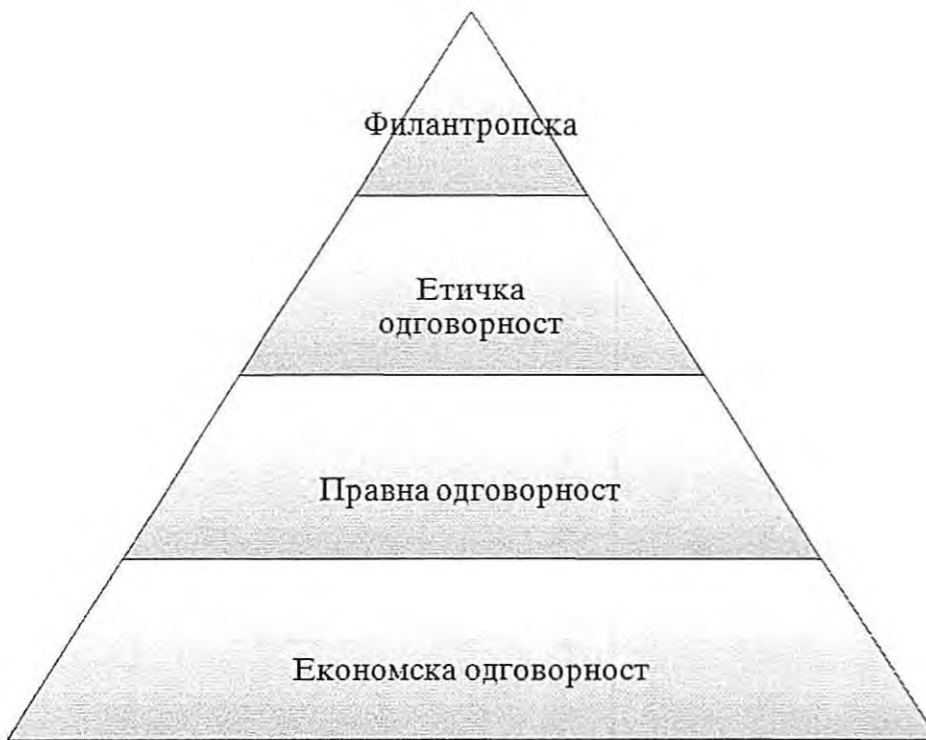
Приказ 2: Пирамидата на Карол (Caroll, 1998)

Во стручната литература повеќе автори се согласуваат дека социјалните одговорности што ги практикуваат бизнисите, а кои ја сочинуваат целокупната корпоративна социјална одговорност на компаниите се состојат од четири компоненти: економска, правна, етичка и филантропска. Карол Арчи ги претставува овие компоненти на корпоративната социјална одговорност во вид пирамида што во литературата е позната како Пирамидата на Карол (Caroll, 1998).