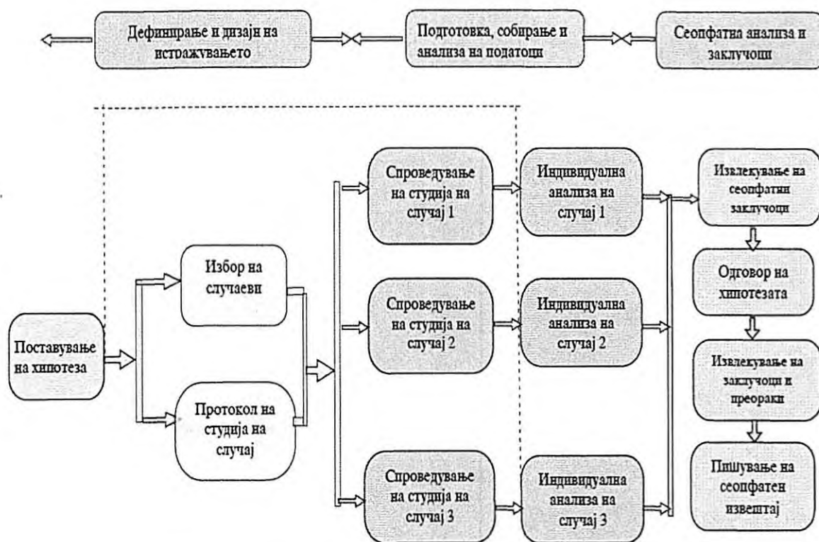
Приказ 3: Студија на случај како истражувачка техника

Постојат неколку стратегии за анализа на добиените податоци во однос на хипотезата: следење на претпоставките и споредување со добиените податоци; детално објаснување на причинско-последичните врски што се предмет на студијата; спроведување со замислен модел и определување на степенот на совпаѓање и хронолошка логичка анализа ако студијата и податоците го дозволуваат тоа.