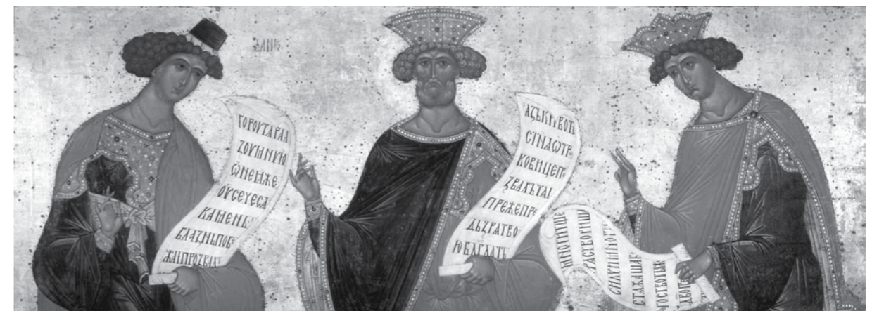
Светите пророци Даниил, Давид и Соломон (Третјаковска галерија, 1947 г.)

Бог чудотвори преку светителите и праведниците (3 Цар 17, 21-22; 4 Цар 4, 33-35; Дела 5, 12-16; 12, 11-12); не само преку оние кои живеат на земјата, туку и преку упокоените светители. Така, пророкот Исаија добива заповед да се врати „кон Езекиил, владетелот на народот“ и да му пренесе дека ќе се спасат тој и народот од рацете на Асирците „заради Мојот слуга Давид“, односно благодарение на Давид, кој веќе не бил во овој живот (4 Цар 20, 4-6).