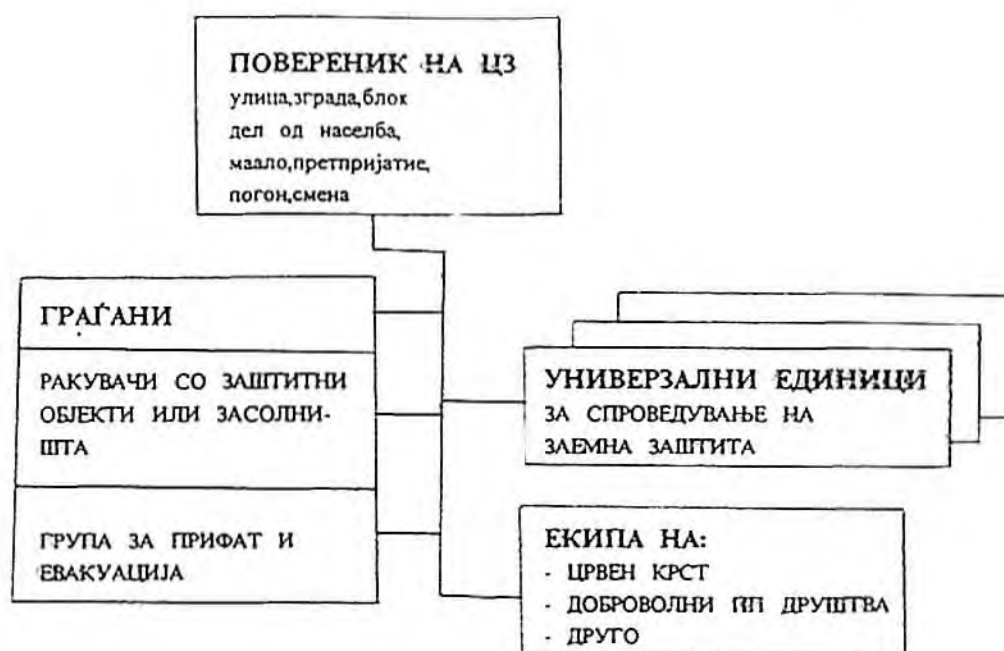
Шема бр.1. Организација на заштитата и спасувањето во основните клетки на живеење и работа

во рамките на спроведувањето на самозаштитата, на припадниците на цивилната заштита задолжени за заштитните објекти или засолништата, на групата за прифат на евакуираното население од други места и подрачја или за евакуирање на дел од граѓаните кои според планот се опфатени со оваа мерка и раководат со "месните единици на цивилната заштита" во јачина од екипа /член 10/.