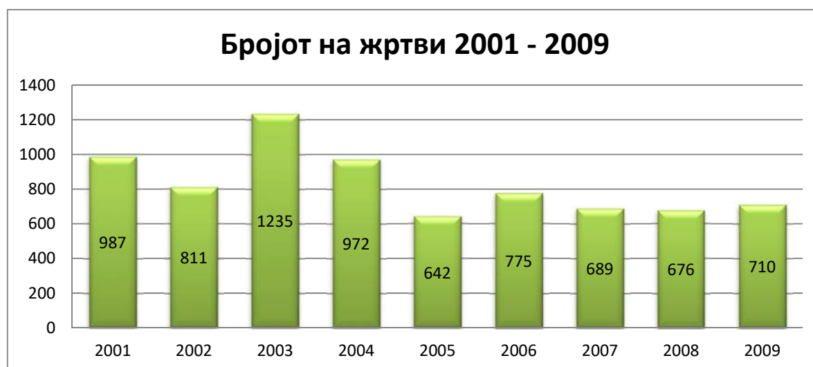
Графикон 5: Бројот на жртвите на трговијата со луѓе во Германија од 2001 до 2009 година

Меѓутоа, во годините претходно според достапните статистичките податоци за Република Германија може да се заклучи дека бројот на жртвите во последните години стагнира. (Графикон 5)