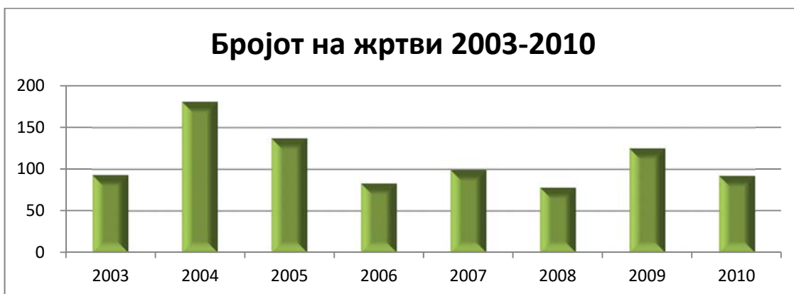
Графикон 3: Бројот на жртви на трговија со луѓе во Грција за периодот од 2003 до 2010 година

За бројот на жртвите зборуваат податоците од Министерството за граѓанска заштита кои се прикажани во следниот графикон: