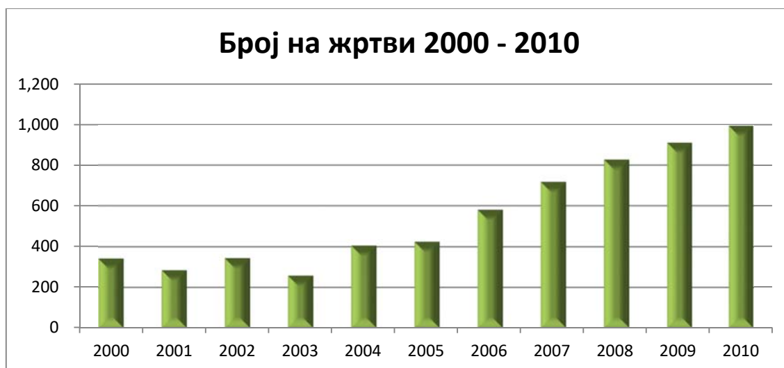
Графикон 4: Бројот на жртви на трговија со луѓе во Холандија за периодот од 2000 до 2010 година

Националните Извештаи за трговија со луѓе укажуваат дека во Холандија отсекогаш постоела тесна поврзаност помеѓу проституцијата и трговијата со луѓе и дека главната причина за легализација на проституцијата е единствено да се совлада трговијата со луѓе. Иако е ова добар аргумент, статистиката покажа нешто друго. Имено, статистичките податоци за периодот од десет години се приложени во следниот графикон 4 (Human Trafficking – ten years of independent monitoring: 111):