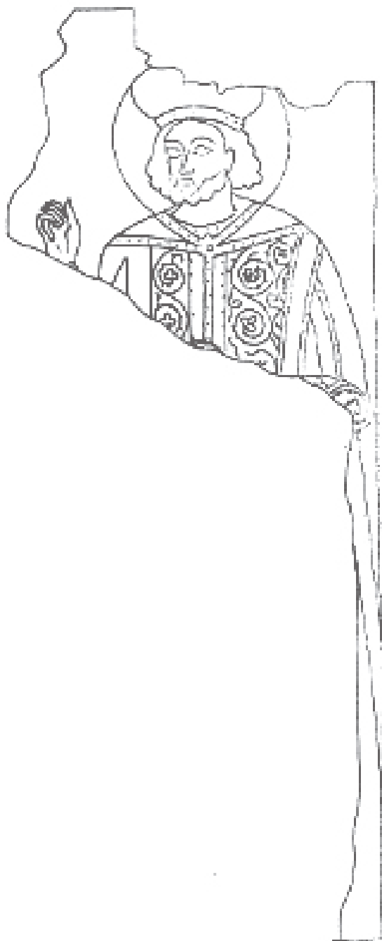
С. 3. Св. Теодор Стратилат, откриен фрагмент под Страхниот суд 1364/5.