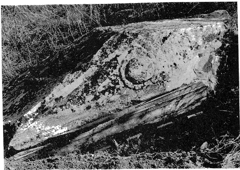
Слика 2: 7 — Дреново

Освен покривите од едикулите, документиравме и карактеристични елементи од долните партии на овие градби. Тоа се делови на подиумот, или крилни плочи кои го носеле покривниот елемент. Овие плочи имаат на својата челна, тесна страна по вертикала пластично претставен јонски или коринтски полустолб со база. Долниот дел од овие плочи пак обично бил класен во облик и со профилација на минијатурен римски стилобат. Вакви плочи од едикули потекнуваат од селата Тремник (сл. 6), Тимјаник, Долни Дисан (сл. 4), долни дел на плоча од непознат локалитет (сл. 5), Дреново (сл. 7). Поранешните истражувања забележале и еден покривен елемент во вид на пирамида. 3 Постаментот на едикулите бил оформен од неколку правоаголни плочи. Во челната, обично во посебно врамено поле, бил