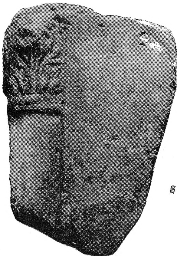
Слика 3: 8 — Дреново

врежуван епитафот. Вакви карактеристични челни плочи од постаментите на едикулите потекнуваат од неколку раноримски некрополи кај селата: Глишиќ, Чашка, Барово, Д. Дисан. 4