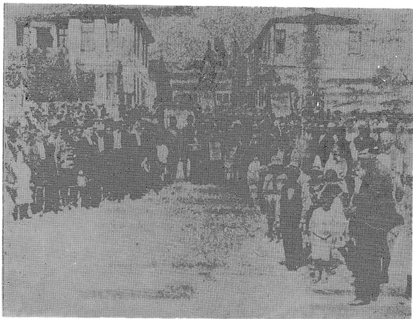
Илинденска прослава во Ортакеј во Цариград 1924 година