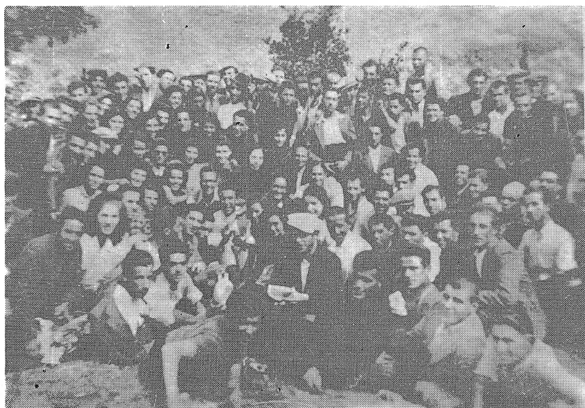
Илинденски излет на велешани