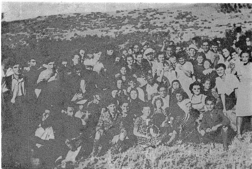
Излетници од Прилеп на излет во с. Ореовец на 2 август 1940 год.