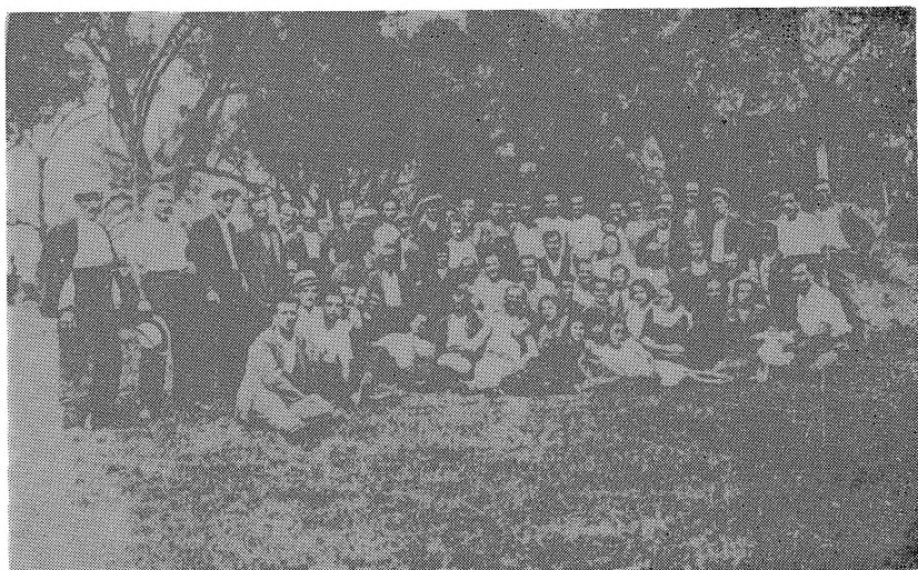
Илинденски излет на македонската колонија во Тирана во 1937 год.