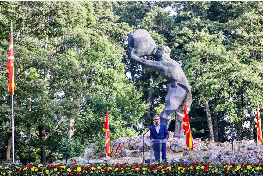
КРУШЕВО НА 02.АВГУСТ 2021

Еве ме на врвот, се искачив сам. И тука не ме следи око ничие. И што, јас во себе пак го шепотам жалосниот сон на своето величие.