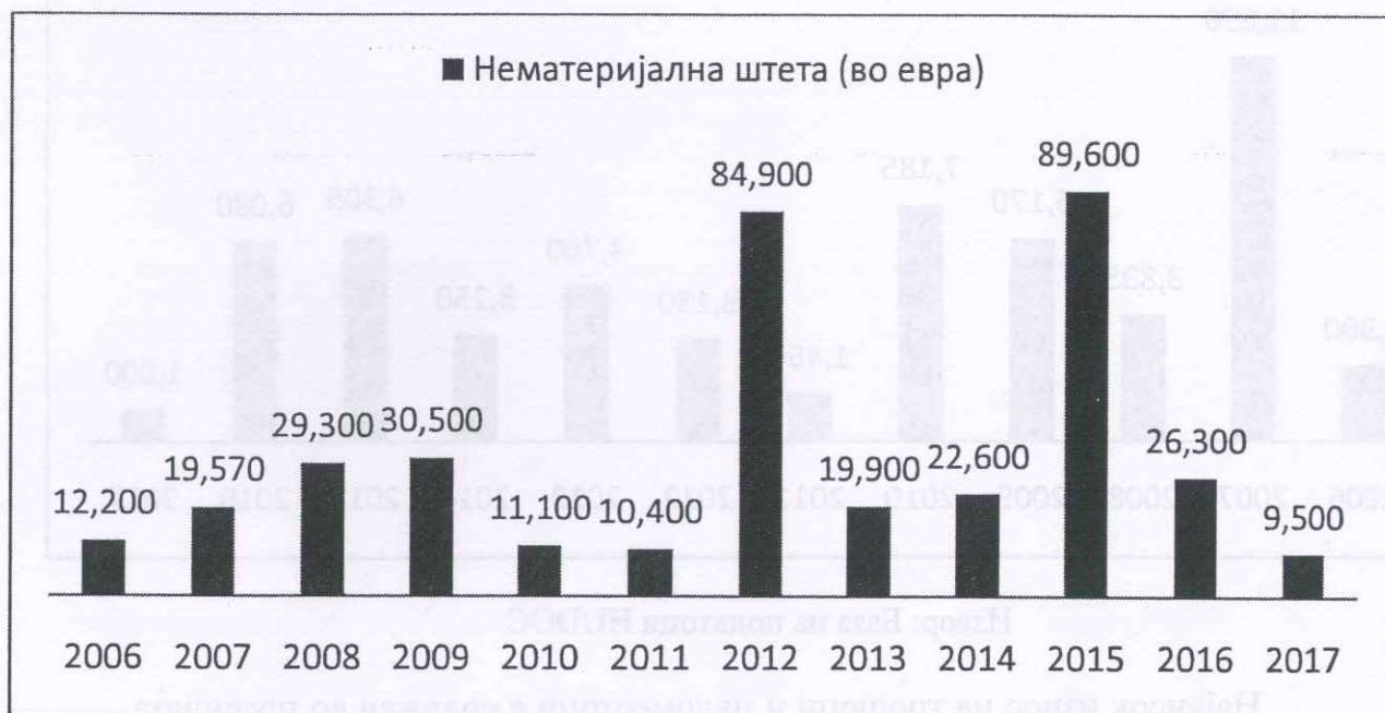
Слика: Вкупен износ на нематеријална штета (во евра)

Износите на нематеријална штета кои ги определува Европскиот суд за човекови права во пресудите кои се однесуваат на Р. Македонија се значително повисоки во споредба со износите на материјална штета. Така, анализата покажа дека во вкупно 90 пресуди Европскиот суд одлучил дека е потребно Р. Македонија да плати нематеријална штета поради повреда на правата на апликантите. Во наредната табела е претставен вкупниот износ кој Р. Македонија била должна да го плати во секоја година одделно по основ на нематеријална штета. Износите се дадени во евра.