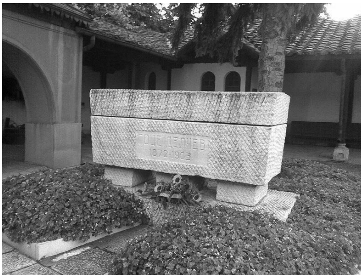
Вечното почивалиште на Гоце Делчев во Црквата Св.Спас во Скопје

Со оглед на влијанието што филателијата го има во светот, се надеваме и очекуваме дека во иднина, на достоинствен начин ќе се одбележуваат значајните датуми од македонската историја, вклучително и ликот и делото на Гоце Делчев.