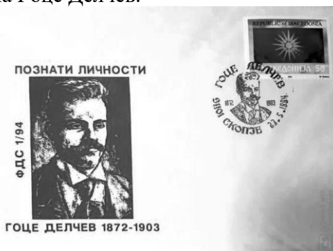
Пригоден коверт издаден од Филателистичкото друштво Скопје во 1994 год.

Следниот пригоден коверт кој бил издаден во Р. Македонија е од Филателистичкото друштво - Скопје во истата година. Повод е издадената марка со ликот на Гоце Делчев.