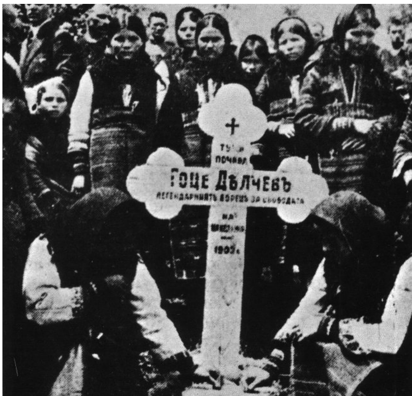
Првиот гроб на Гоце Делчев во Баница