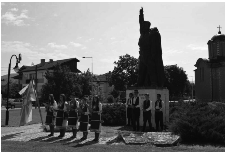
Меѓународна манифестација „Гоцеви денови“ пред споменикот на Делчев во Делчево