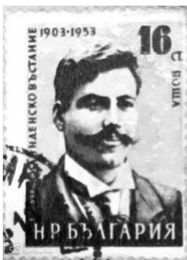
Гоце Делчев на поштенска марка издадена од бугарската пошта во 1953 година.

Македонија, кој е во состав на Бугарија, иако процесот на укинувањето на културната автономија во тој регион, веќе бил завршен. Така што, објавувањето на ова марка, може да се протолкува и во тој контекст. Имено, на оваа марка, сè уште стои називот „Илинденско востание“, што не е случај со понатамошните изданија на марките на кои стои називот „Илинденско - Преображенско востание.