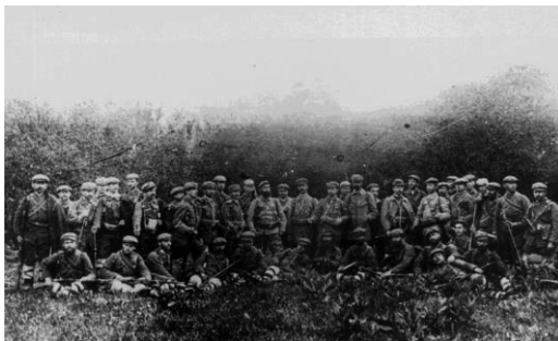
Четата на Јане Сандански

Оттогаш па сè до крајот на животот, длабоко во него била залегната идејата за самостојна ослободителна борба, која му станала преовладувачка животна определба. Тој ја надминал дотогашната практика на поединачно зачленување на луѓето од градските средини и постојано се движел во агитација и организација меѓу селанството. Сеќавајќи се на ова Даме Груев, воодушевено истакнува: „Делчев веднаш ми направи впечаток со својата отвореност и честост. Тој беше, при првите обиди да зачленува, дури и претерано отворен, па требаше да го контролираме за да не ја издаде нашата слабост, слабоста на Организацијата. Тој сè се стремеше да си ја каже вистината, мислејќи дека секој треба да ја усвои идејата така како што тој ја усвоил. Беше многу прав.“ 207 И навистина,