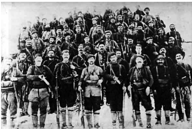
Гоце Делчев со серската чета

По повод годишнината од Илинденското востание весникот „Македонски вести” во 1936 ќе донесе повеќе написи за истото. Насловот на првата страница е „Илинден – македонски национален празник”. И меѓу другото се потенцира: „Македонскиот народ си има свој национален празник. Тоа е Илинден. – Денот на кој кога македонскиот роб излезе на решителен двобој со султанските потисници за национално ослободување и економска благодет”. 245