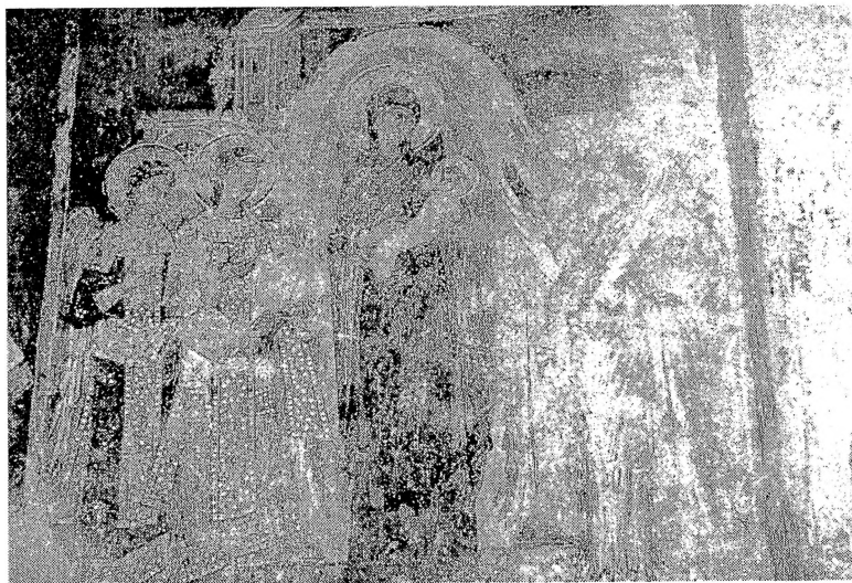
Сл.5 - Свѣѣа Боѡородица - Маѣејче VIII кондак