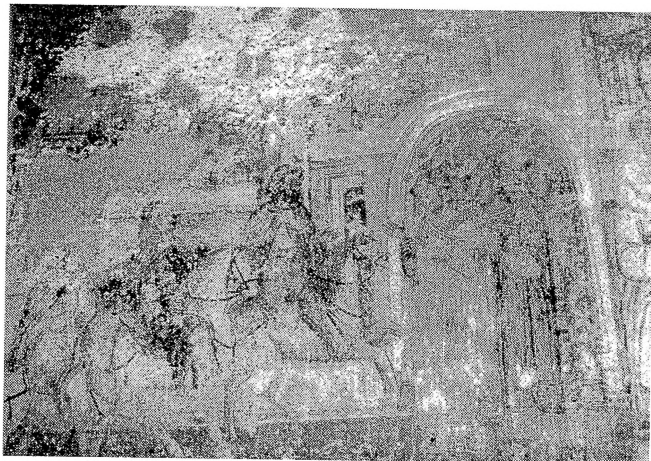
Сл.1 - Свѣѣа Боѡородица- Маѣејче V кондак