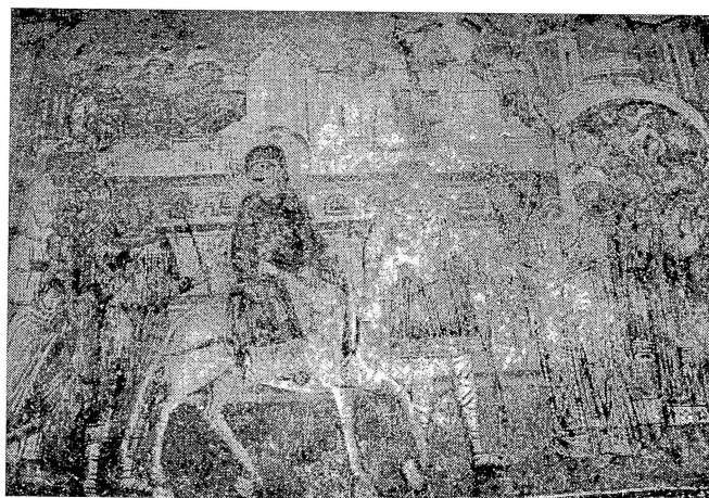
Сл.2 - Свѣѣа Боѡородица- Маѣејче VI икос