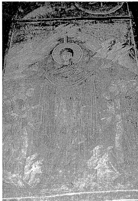
Сл.6 - Свѣѣа Боѡородица- Маѣејче XI икос