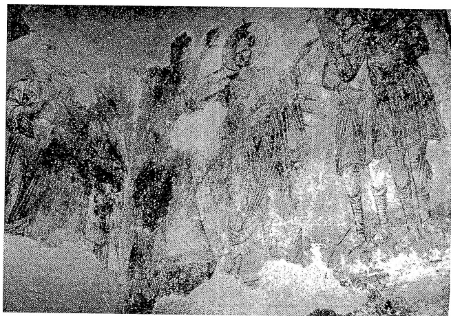
Сл.3 - Свѣѣа Боѡородица- Маѣејче VII икос