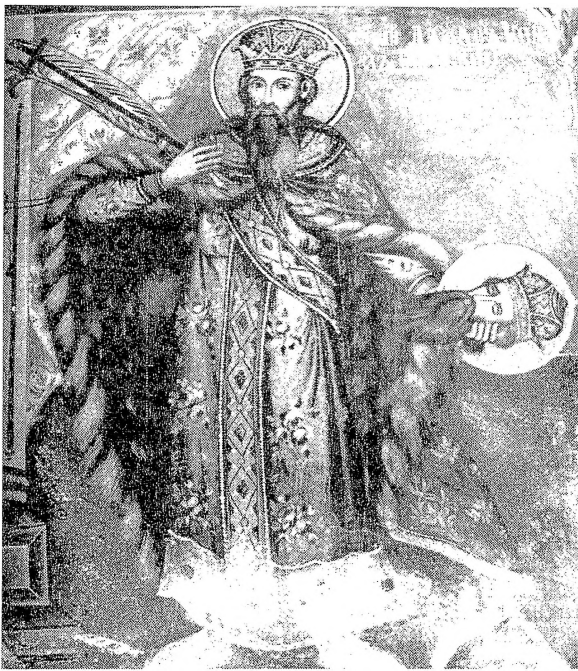
5. Св. кнез Лазар, црква Св. Георгија, Рајчица, Дичо Зограф