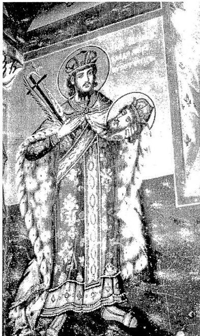
2. Св. Јован Владимир, црква Св. Георгија, Рајчица, Дичо Зограф