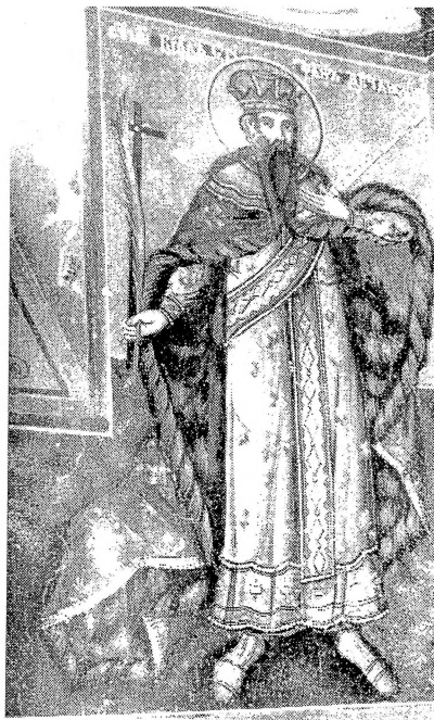
3. Св. Сїефан Дечански, црква Св. Георѓија, Рајчица, Дичо Зограф