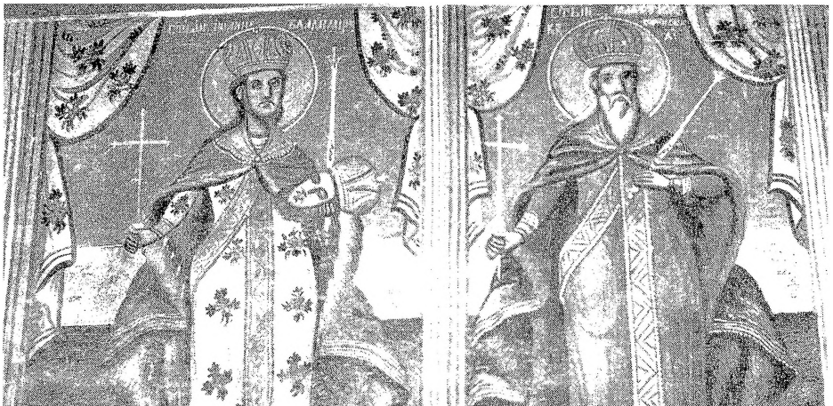
6. Св. Јован Владимири и Св. крал Милутиин, црква Св. Никола, Вевчани, Аврам Дичов