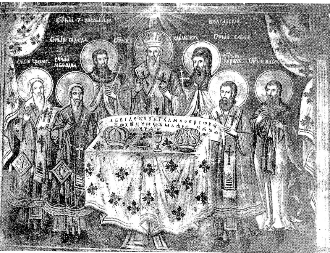
9. Св. Седмочисленици, црква Св. Никола, Вевчани, Аврам Дичов