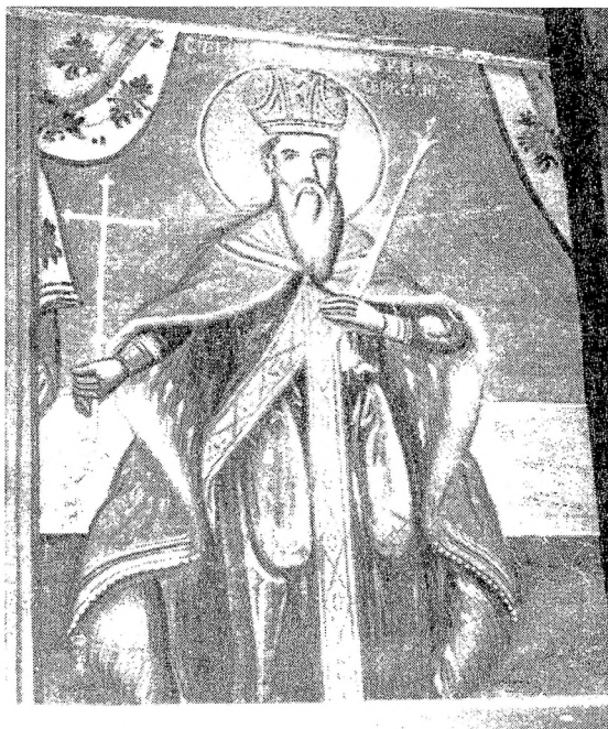
7. Св. крал Владислав, црква Св. Никола, Вевчани, Аврам Дичов