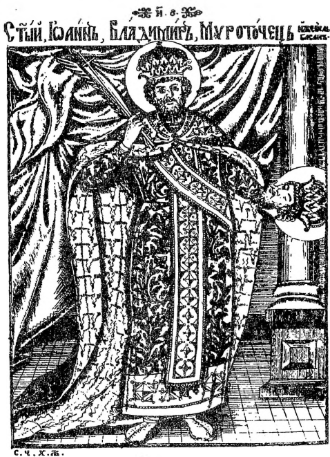
11. Св. Јован Владимир, Х. Жефарович, Сѣмѣиоѳрафија