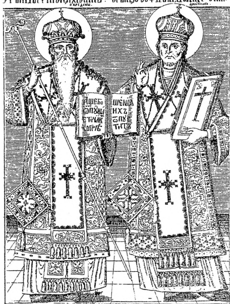
13. Св. Климентій и Св. Теофилакѣи, X. Жефарович, Сѣмаѣиоѳраѣја

Свѣтъ Климѣи ѿвѣкъ ~ Свѣтъ Софѣлак Болгарскѣи