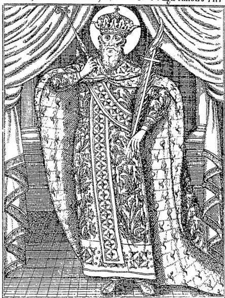
12. Св. Милуѣин, X. Жефарович, Сѣмаѣиоѳраѣја

3.7.26 Свѣтъ, милостивъ, мучоточецъ иже ѿсефи.