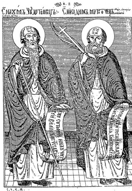
10. Св. Наум Охридски и Св. Никодим Мироточец, Х. Жефарович, Сѣмѣиоѳрафија