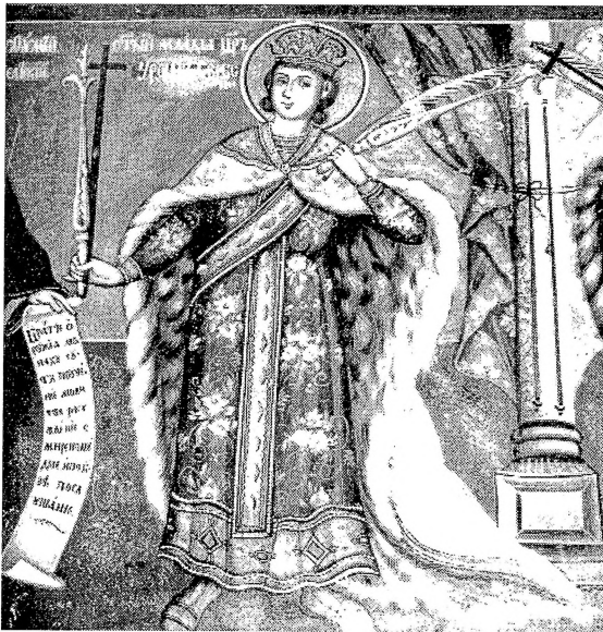
4. Св. млад крал Урош, црква Св. Георѓија, Рајчица, Дичо Зограф