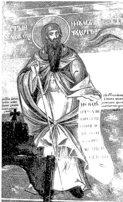
1. Св. Наум Охридски, црква Св. Георгија, Рајчица, Дичо Зограф