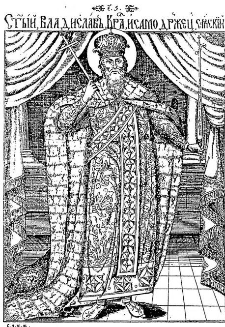
14. Св. Владислав, Х. Жефарович, Стѣматѳографѳија

обновување на Охридската архиепископија. Во живописувањето на овие цркви ктиторството на селаните се подвлекува и во натписите. Митрополит Натанаил сигурно имал посредничка улога во подигањето, а особено во живописувањето на црквите во својата епархија.