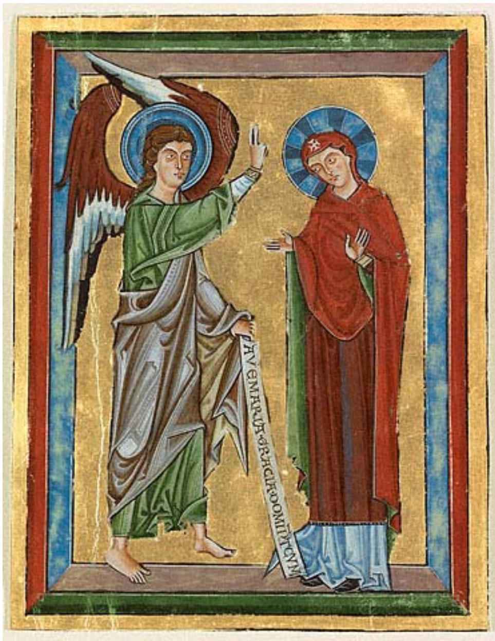
(Благовестие, Вурзбург околу 1240 година)

Германските уметници често позајмувале теми и стилови од византиската уметност. Во овој случај Марија е облечена во византиски превез. Златната позадина, рамките и осветлувањето на драперијата на ангелот исто така рефлектираат византиски уметнички аспекти.