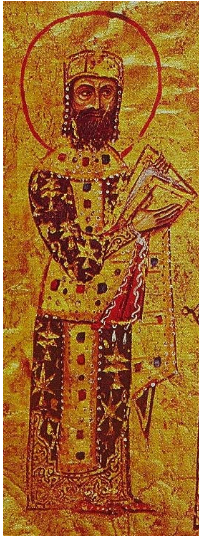
(Алексиј I Комнин, византиски портрет од минијатура, околу 1300 година,)

Мала Азија, во првите години од владеењето на Алексиј I Комнин, била во рацете на султанот Сулејман ибн-Кетелмуш, со центар во Икониум (Конија). Врховната власт над оваа територија му била одобрена од неговиот номинален сизерен, багдатскиот калиф Малик-шах. Кога во 1084 година Сулејман ја освојува Антиохија, тој ја лишил Византија и од нејзиното последно важно упориште. Со тоа е нанесена непоправлива штета на византиската власт на исток, иако изсвено влијание Византија задржала кај локалното ерменско население во Сирија. Безначајните локални владетели, коишто со помош на Византија или калифатот им одолевале на сулејмановите претензии, сега биле приморани