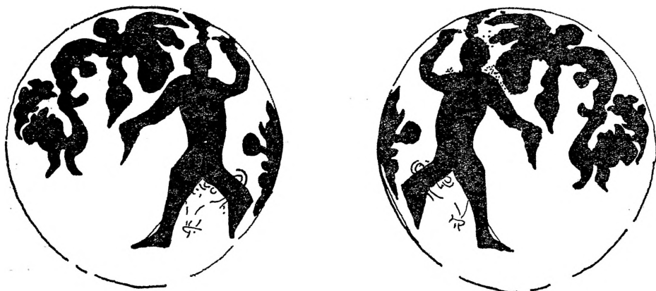
Сл. 1. Цртеж на Астрапа во трактатот за Теорија за Месечината на Димитрија Триклиниј од ракописот на Пар. гр. 2381, ф. 78 (препис од XV — XVI век).