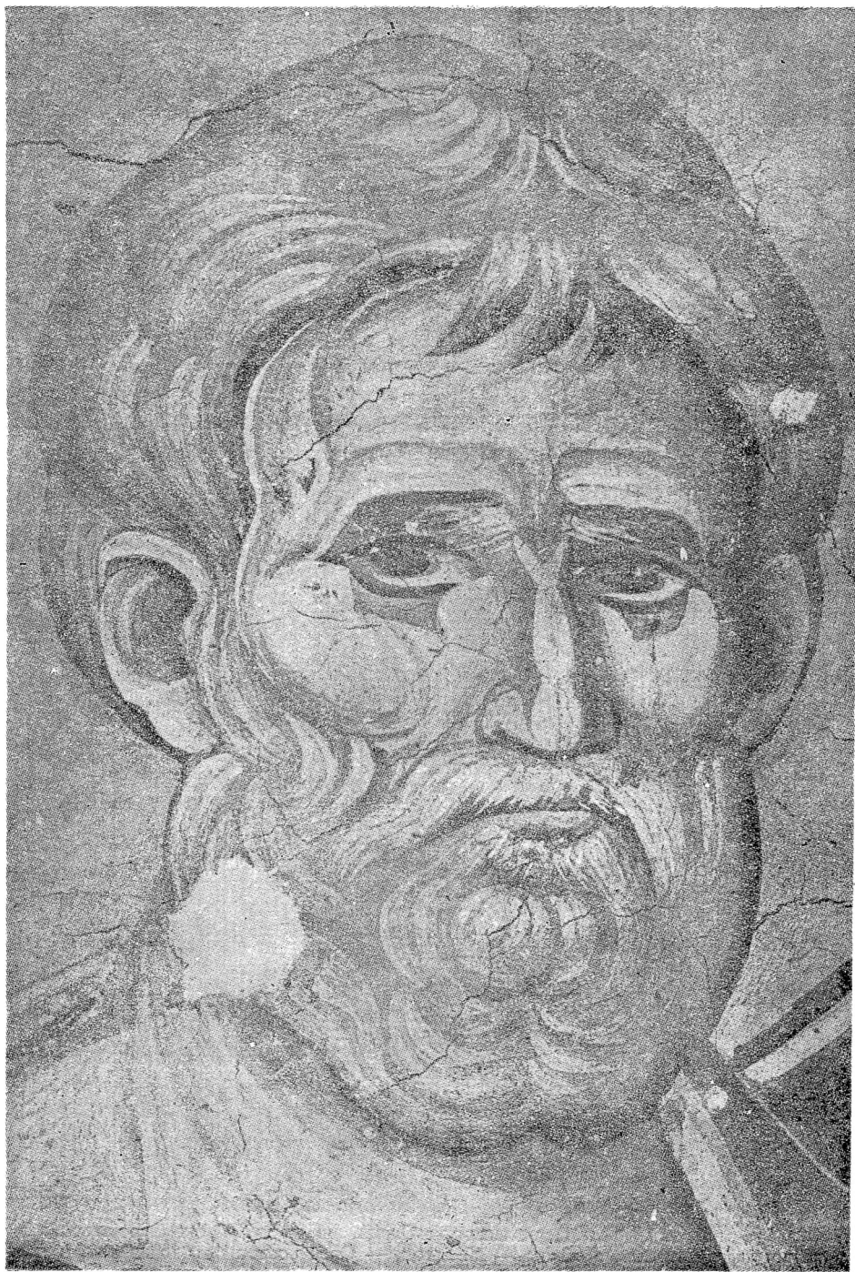
Таб. II Фреска од црквата Перивлептос во Охрид, лик на св. Петар (од 1295 г.)