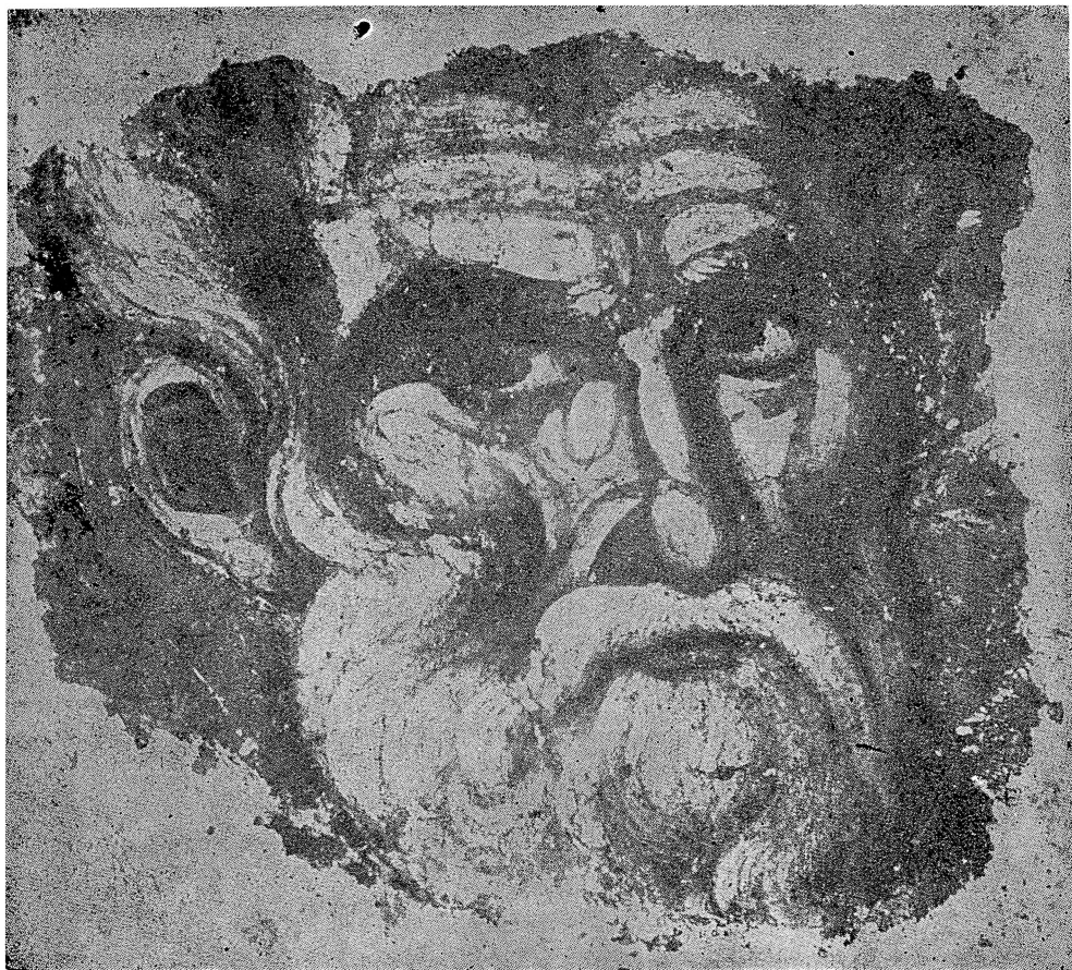
Таб. IV. Фреска во Лавра на Света гора, лик на св. Никола (анонимно дело што може да се припише на товрештвото на зографите Михаило Астрапа и Еутихиј — околу самиот крај на XIII и прва деценија на XIV век).