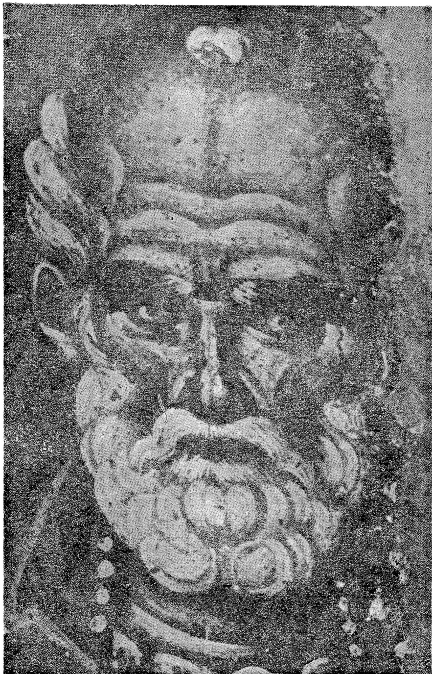
Таб. III. Фреска од црквата во Протатон на Света Гора, лик на св. Никола (анонимно дело што може да му се припише на творештвото на зографите Михаило Астрапа и Еутихиј—околу самиот крај на XIII и првата деценија на XIV век).