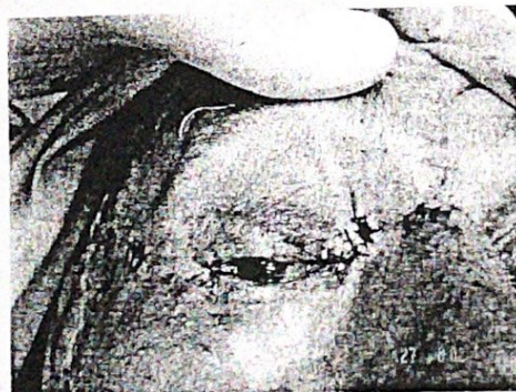
ѓ. по втора операција