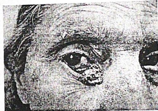
а. плоскоцелуларен карцином