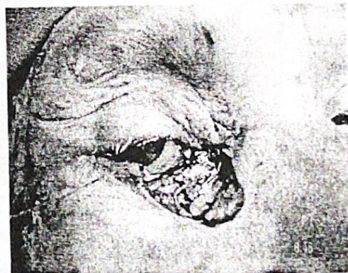
б. постексизионен дефект