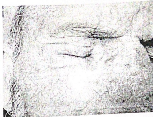
е. по 1 месец