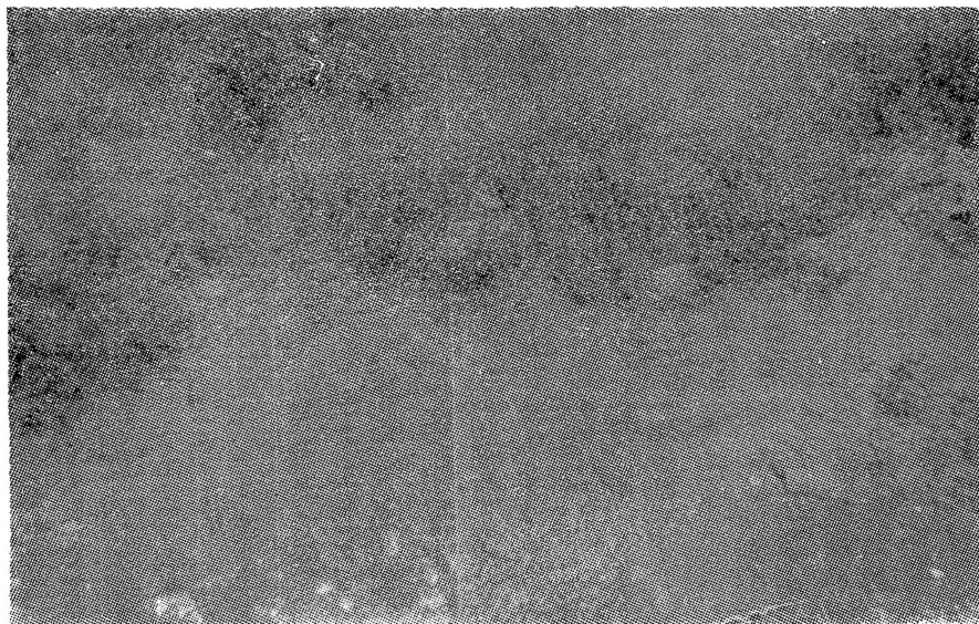
Сл. 2. — Дел д источниот сид од северниот кораб на базиликата, гледан од северозападната страна (на сл. 4 означен со Б).