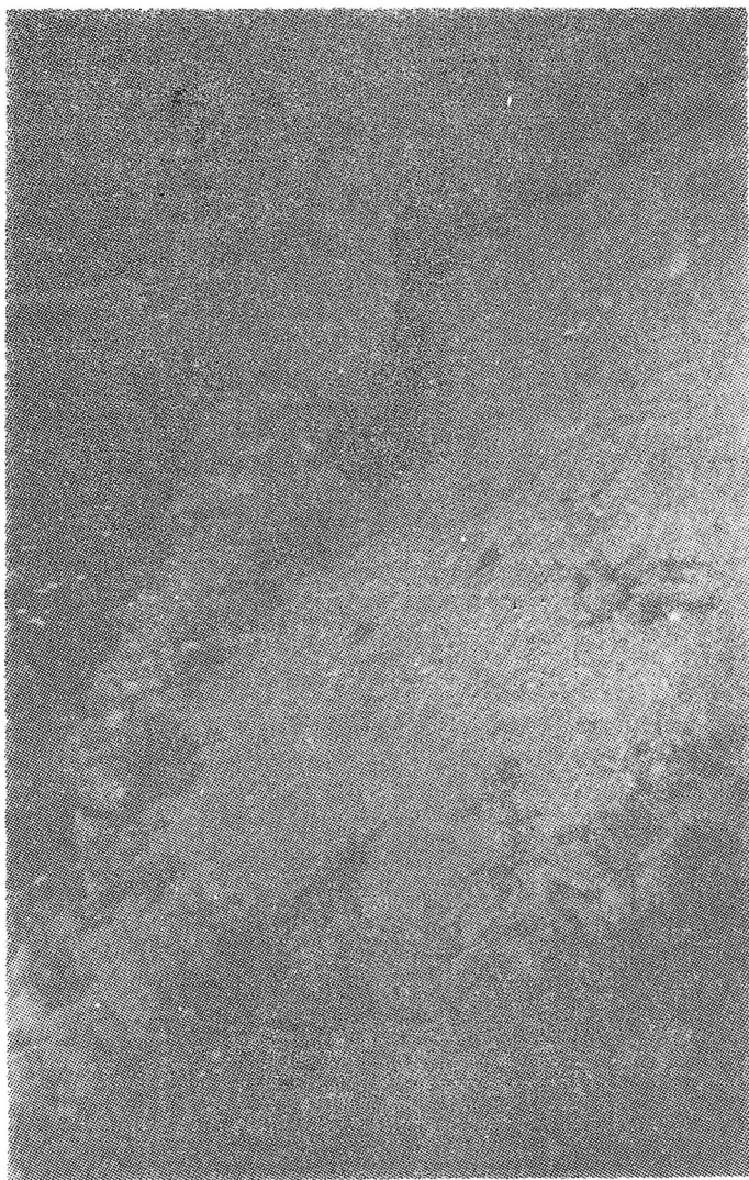
Сл. 1. — Северниот вид од северниот кораб на базиликата, гледан од западната страна (на сл. 4 означен со А). Јужно од него се гледа дополнителното насипување на северниот кораб (на сл. 4 означено со G sec.).